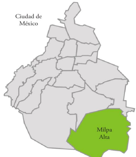
Mapa 1 Ubicación de la alcaldía de Milpa Alta en la Ciudad de México