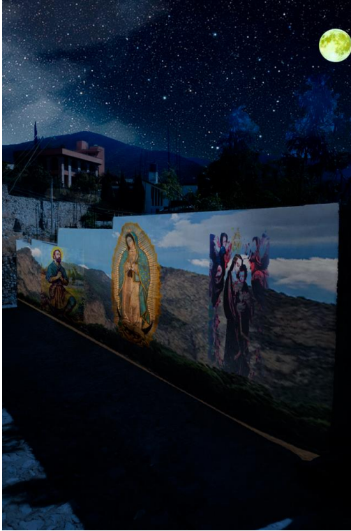
Imagen 5 y 6 imágenes muestra del proyecto de mejoramiento barrial en Metztitlán, Hidalgo donde se pretende adornar calles y callejones con la cultura e historia local, ayudando tanto a brindar seguridad vecinal como incentivar el turismo de la zona.