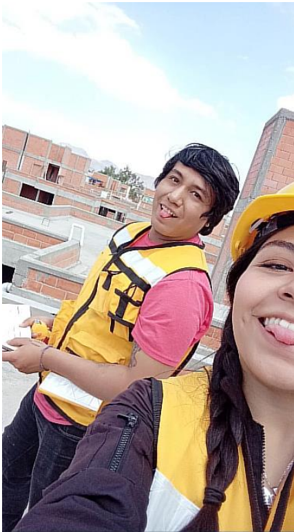
Imagen 8.- Manzana 25 2da sec. Jara Lira, 2023