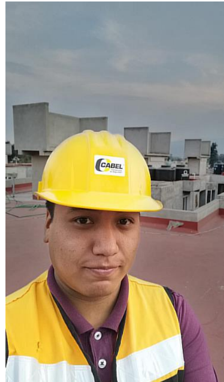
Imagen 9.- Tlaxilacalli, acervo personal, 2023