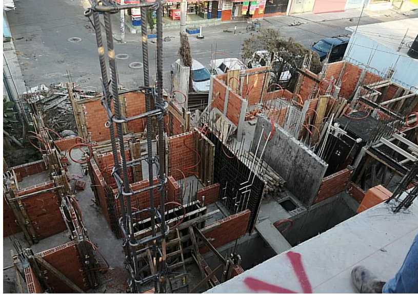
Imagen 7.- Manzana 25 2da sec. JAR'UAJPARIN, 2023

Imagen 7-9 dentro de estas imágenes se puede dar a notar los trabajos de recorrido y supervisión dentro de los proyectos; Manzana 25 segunda sección como en Tlaxilacalli con los cuales se lleva el registro de avance de obra.