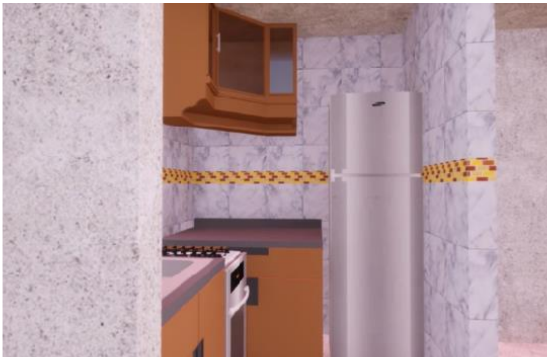
Imagen 4.- Renderizado interior Tlaxilacalli. Acervo personal, 2023