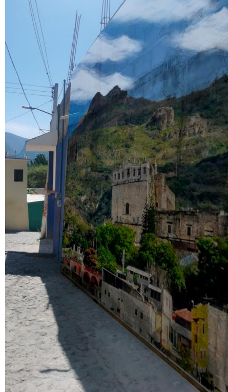
Imagen 5-6.- Proyecto "Callejón cultural Metztitlán", Hidalgo.