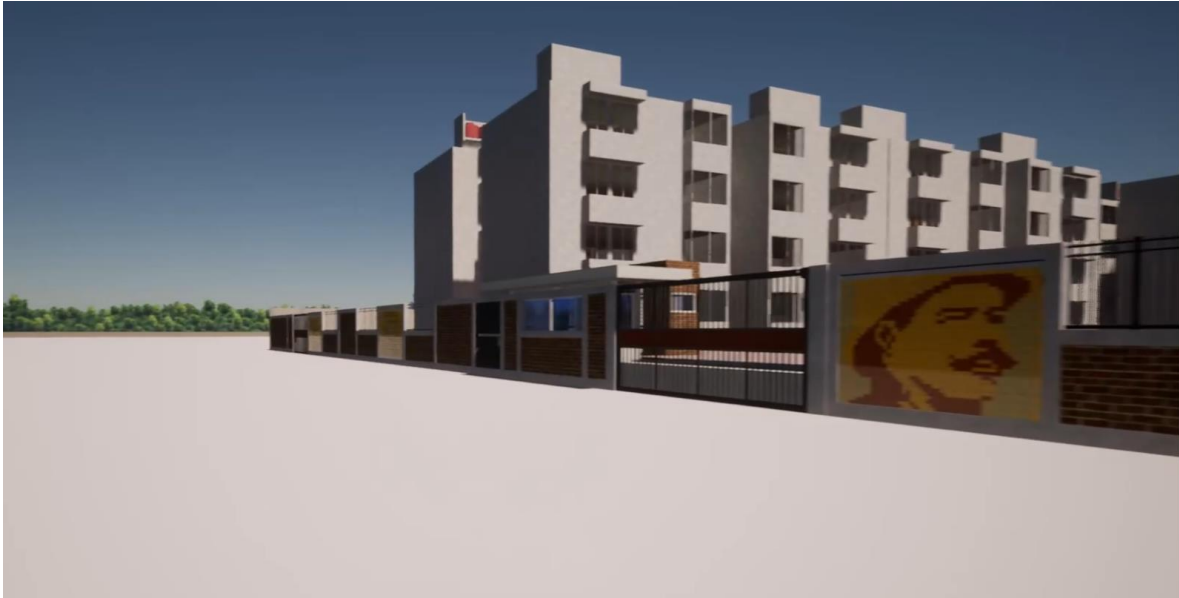
Imagen 3.- Renderizado exterior Tlaxilacalli.

Imagen 3 y 4 se muestran renderizados 3D del proyecto Tlaxilacalli en el cual se pueden observar las texturas finales tanto de exteriores como interiores para el momento de entrega de este.