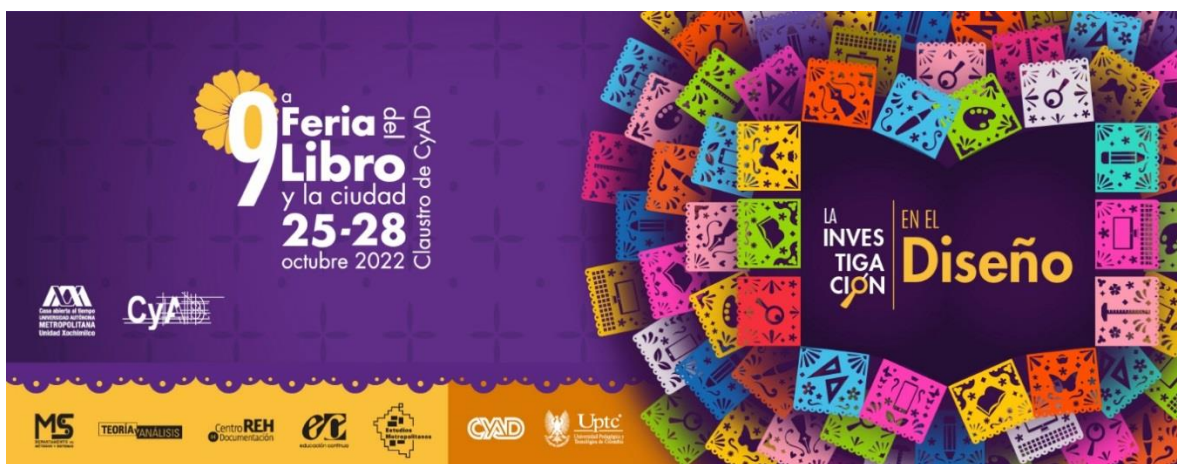
Imagen 6: Cartel novena feria del libro, 2022. UAM-Xochimilco

del ecourbanismo para ciudades de América Latina, 8)El demonio de la perversidad, 9)Cenizas en la Aurora, 10)Sueño de una noche naif, 11)Diseño de un cartel, 12)Entre mis letras te leas, 13)Eva inolvidable y 14)Los crímenes de los sirgueros guadalupanos. Por otra parte, tuvimos el taller “Un acercamiento a la encuadernación” y el curso “Pinta tu ciudad: Marbling, técnica de papel marmoleado” donde se empleaba una técnica de pintura de aerosol en agua y que a la vez se sumergía un pedazo de cartulina con cortes de monumentos emblemáticos de la ciudad de México y que por ultimo dejabas secar al rayo del sol, lo que concluía con una obra de arte (Imagen 7). Entonces participamos en la organización y logística de la feria, así como la atención a las editoriales y a los usuarios y en la ejecución de los talleres y presentaciones de los libros.