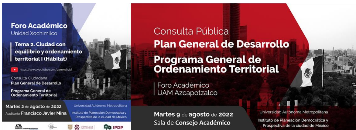
Imagen 4: Consulta ciudadana del Plan General de Desarrollo y Programa General de Ordenamiento Territorial