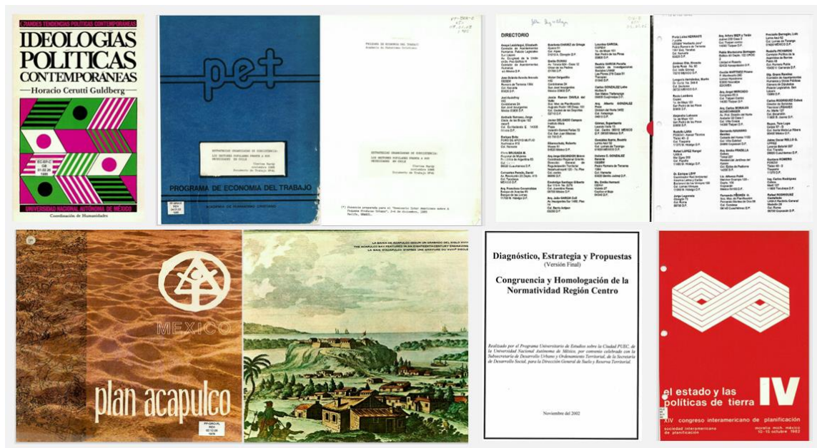
Imagen 1: Portadas de materiales digitalizados

Digitalización de documentos: Recién ingresado al servicio social realice la recopilación y traslado de documentos del centro de documentación sobre la ciudad “Roberto Eibenschutz” al PUEM para que posteriormente fueran digitalizados. Estos documentos eran libros, revistas, periódicos, tesis, tesinas, planes y programas tanto estatales y municipales, cartografía, entre otros con temas extensos por ejemplo arquitectura, contenido de urbanismo, política, economía, asuntos sociales, medio ambiente, medio natural, problemáticas metropolitanas y rurales, cultura, arqueología, etc; para poderlos digitalizar fue necesario desempastarlos, quitar grapas o broches y en ocasiones también se tenían que cortar los documentos por el tamaño de la hoja; al terminar de digitalizarlos se tenían que revisar para comprobar que se hayan escaneado de buena forma para que el documento fuera comprensible. La cantidad de documentos digitalizados fueron 934 documentos.