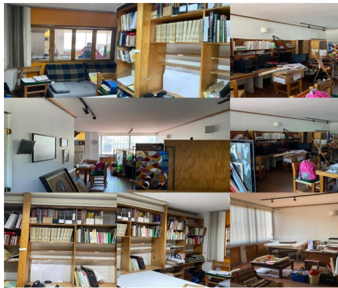
Imagen 2: Consultoría DIPIA

esta consultoría se encuentra en calzada. de Tlalpan, local 110, Belisario Domínguez sección 16, Tlalpan, código postal 14080 Ciudad de México. Dicha donación fue registrada en la base de datos del centro de documentación sobre la ciudad “Roberto Eibenschutz” y que contenía libros, revistas, planos, croquis, mapas e investigaciones que en total fueron 449 ejemplares registrados. El registro se llevó a cabo por temas que fueron economía, planes y programas, estudios y proyectos, presupuesto financiero, ordenación, metrópoli, suelo, administración, derecho, medio ambiente, transporte, infraestructura, equipamiento, arquitectura, vivienda, educación universitaria, sociología y participación, demografía, instrumentación, metodología, tesis y cartografía, que a la vez se dividían en subtemas (Imagen 3).