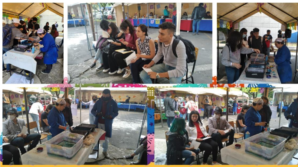
Imagen 7: Taller pinta tu ciudad. Marbing, técnica de papel marmoleado