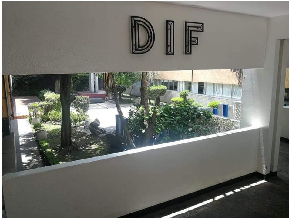
Imagen 2. Pasillo que conecta pabellones y patio principal de menores.