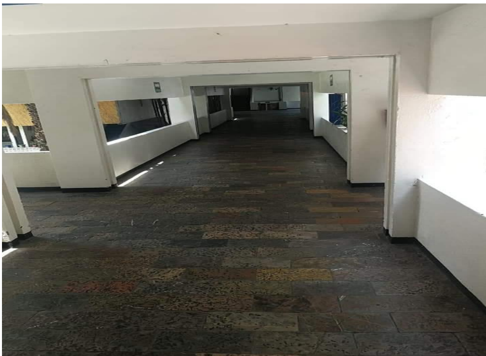
Imagen 3. Vista general de pasillo principal hacia pabellones de estancia.