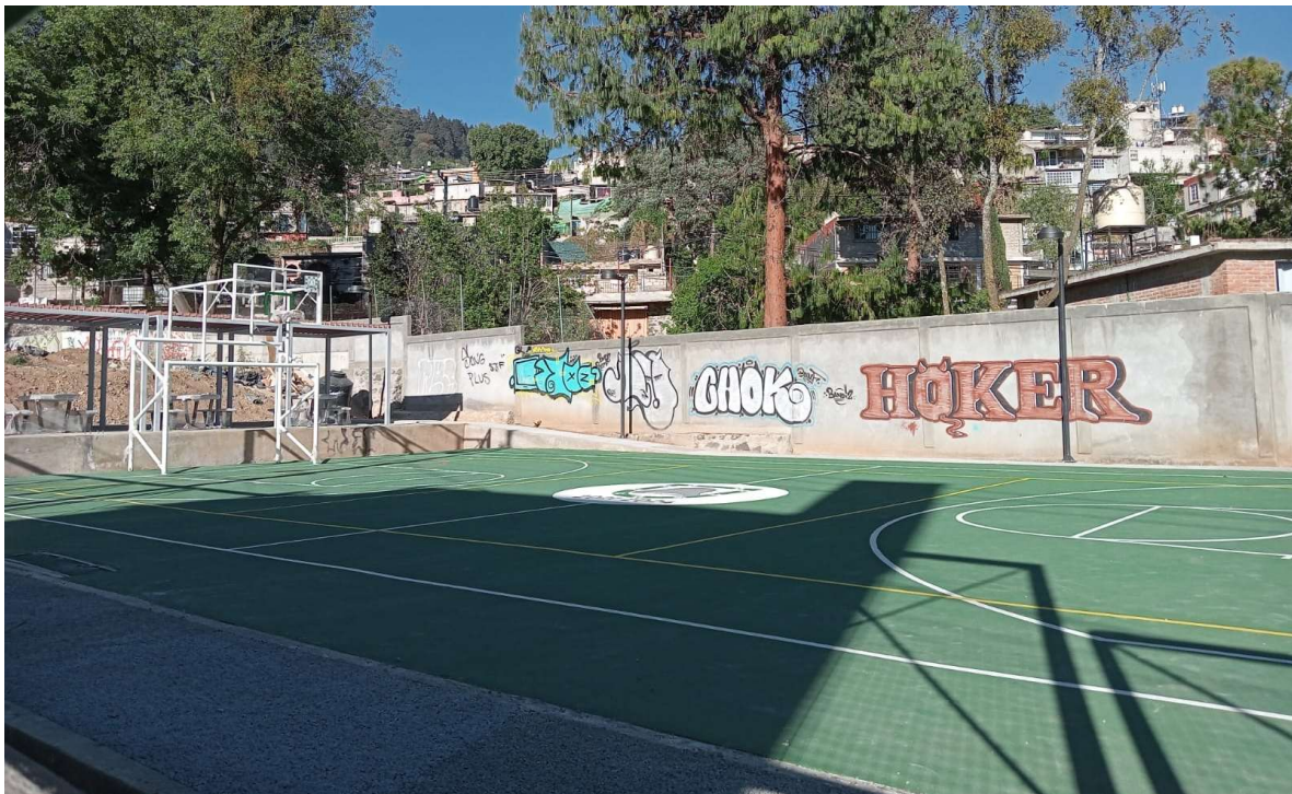
Imagen 3. Cancha de usos multiples, pista de trote y área recreativa al termino de mi prestación de servicio social.

“Paseo CriCri” ubicado en Calle Paseo Francisco Gabilondo Soler s/n, colonia San Jerónimo Aculco, C.P. 10400, CDMX., El enfoque de este proyecto fue el rescate de este andador renovando luminarias, equipamiento y pavimentos para darle el enfoque “infantil” que representa este icónico andador dentro de la demarcación.