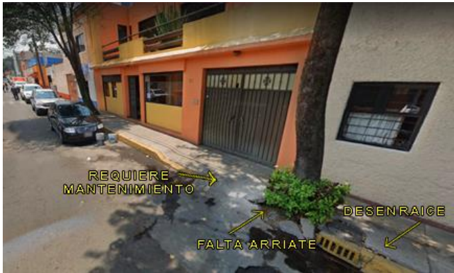
Imagen 3.1 Calle "Victoria" secc. Norte. Colonia Copilco el bajo.