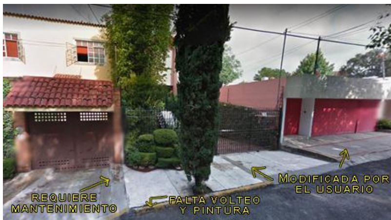
Imagen 2.1 Colonia Romero de Terreros.