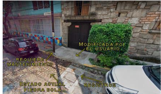
Imagen 3.2 Calle "Victoria" secc. Sur. Colonia Copilco el bajo. Extraída de google Maps con edición propia

En este otro caso, ubicado en la colonia de Copilco el bajo , su peculiaridad es que no todas las calles (refiriéndome al paso vehicular) presentaban las mismas condiciones de acabados. En las fotografías se puede percibir que nos referimos a la misma vialidad (de Nombre Victoria ) y en la misma, cambia tres veces de morfología; comienza siendo en piedra bola, después de unos metros pasa a ser carpeta asfáltica y al final y al resto de su extensión vuelve a ser piedra bola. Algunas otras calles paralelas a esta analizada también tenían un trabajo diferente, como lo son principalmente en adoquín, pero al final la subdirección de obras, lo registrará de una sola forma pues el catálogo ya está preestablecido. En el reporte se tomó en cuenta que el estado actual de cada una de las calles es diferente; así que se toman los nombres correspondientes y el número de referencia, y se marca el tipo de vialidad que es para levantar el reporte y se hagan los trabajos necesarios para que esto quede en carpeta asfáltica.