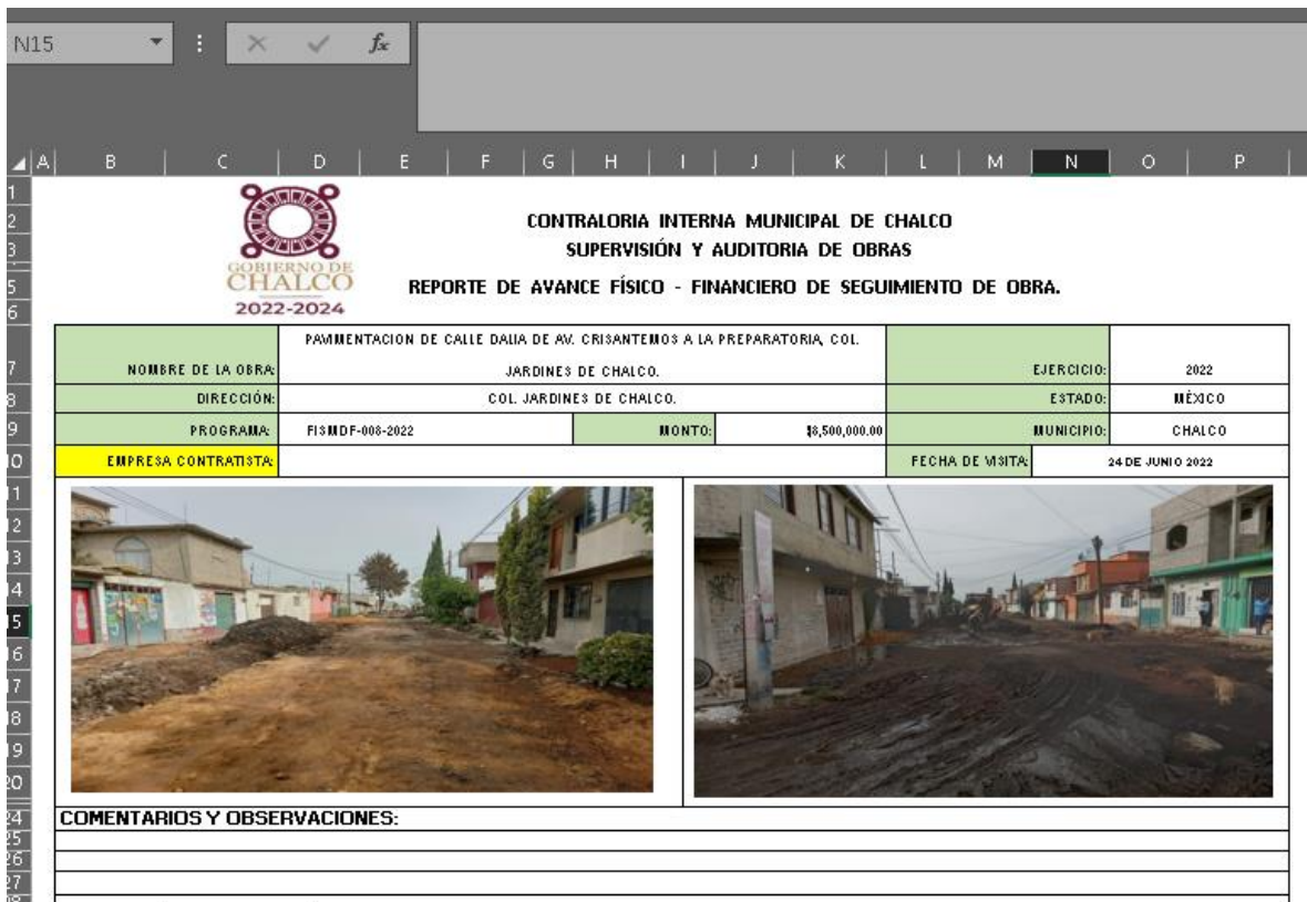
Imagen 3 y 4. Fotos tomadas en obra de colocación de drenaje y pavimentado de calle.