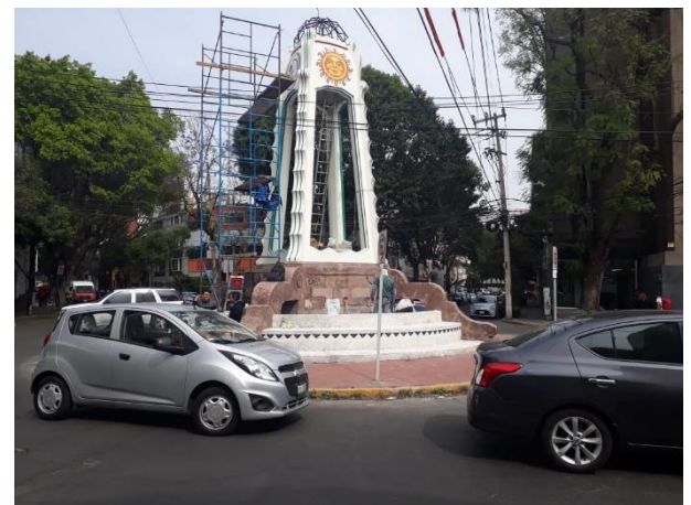
Fotografía 1. Restauración de la fuente Sevilla.

Para poder intervenir con una propuesta de remodelación o construcción es muy usual el preguntar ¿qué costo tendrá?, precisamente esa es la importancia de un “catálogo de conceptos”, para el cual se realizó con la ayuda del documento CIPU de la Ciudad de México. Existieron conceptos de los cuales no se encontraron en este documento, por lo cual se tuvieron que cotizar con proveedores privados y así realizar una estimación más precisa.