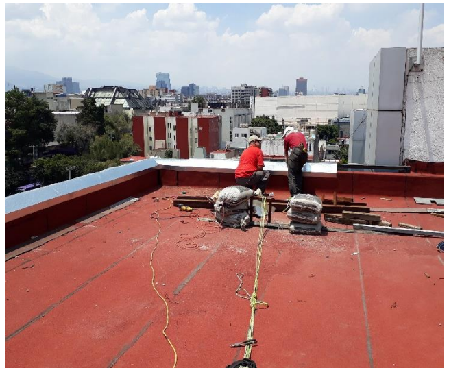
Fotografía 4. Obreros trabajando en la azotea del edificio

Por último, esta actividad y no menos importante consistió en ir a obra y revisar los trabajos de los obreros, tales como cancelería, impermeabilización de azotea, colocación de tapa juntas y preparación en el cubo del elevador, para poder realizar el montaje correctamente del elevador. Junto con esta supervisión se llevó a cabo la realización de bitácora de obra, el cual es bastante importante en obra ya que se tiene el registro diario del avance de trabajo de los obreros, con un conteo ya sea por metro lineal, cuadrado o por pieza según el catálogo de conceptos.