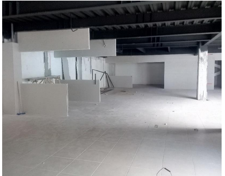
Fotografía 3. Edificio donde realizaron los planos As Built.

Este tipo de planos resulta un poco complicado realizarlos ya que, a parte del levantamiento arquitectónico actual, se deben de tomar en cuenta los acabados en muros y los tipos de cancelas que tienen en ventanas, así como el tipo de puertas (abatibles, corredizas), el tipo de material (madera, aluminio) o puertas de emergencia. Para esta actividad se necesitaron instrumentos de apoyo como flexómetro y distanciómetro para hacer el trabajo más fácil.