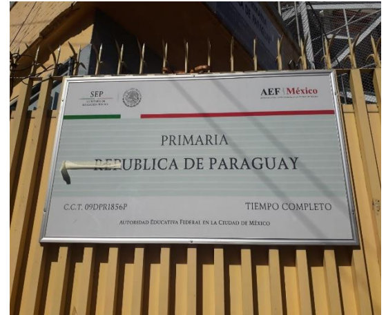
Fotografía 2. Nombre de la escuela visitada.

Dicha actividad consistió en visitar algunas de las escuelas primarias de la alcaldía Benito Juárez, en las cuales se evaluaban de acuerdo con un formulario en el cual contiene los apartados como: evaluación de sistema estructural, acabados, pintura, instalaciones, herrería, mobiliario, luminarias. En este ejercicio se recorre toda la escuela junto con algún encargado, ya sea conserje, secretario etc., el cual nos mencionaba las inquietudes de las instalaciones para poder así generar un reporte con fotografías de las zonas bañadas o en malas condiciones.