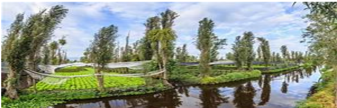
Imagen de las chinampas.

El salto de chinampas a invernadero nos está hablando de un salto gigante en las técnicas de cultivo, que si bien se siguen conservando algunas se van perdiendo otras, es parte de una innovación, pero es importante mencionar que en los invernaderos de Xochimilco no se ve una innovación gigante en tecnología , son pasos que se han dado de poco a poco, que si bien el trabajo sigue siendo pesado estamos hablando de un reajuste de técnicas por la urbanización, la cual su acelerada creciente ha impactado en el deterioro del medio ambiente, que ha orillado a los cultivadores a tomar otras medidas, ocasionando que al dejar atrás las chinampas la cultura se vaya transformando, obligandonos como sociedad a sobresalir frente a los nuevos retos que se van formando transformando espacios.