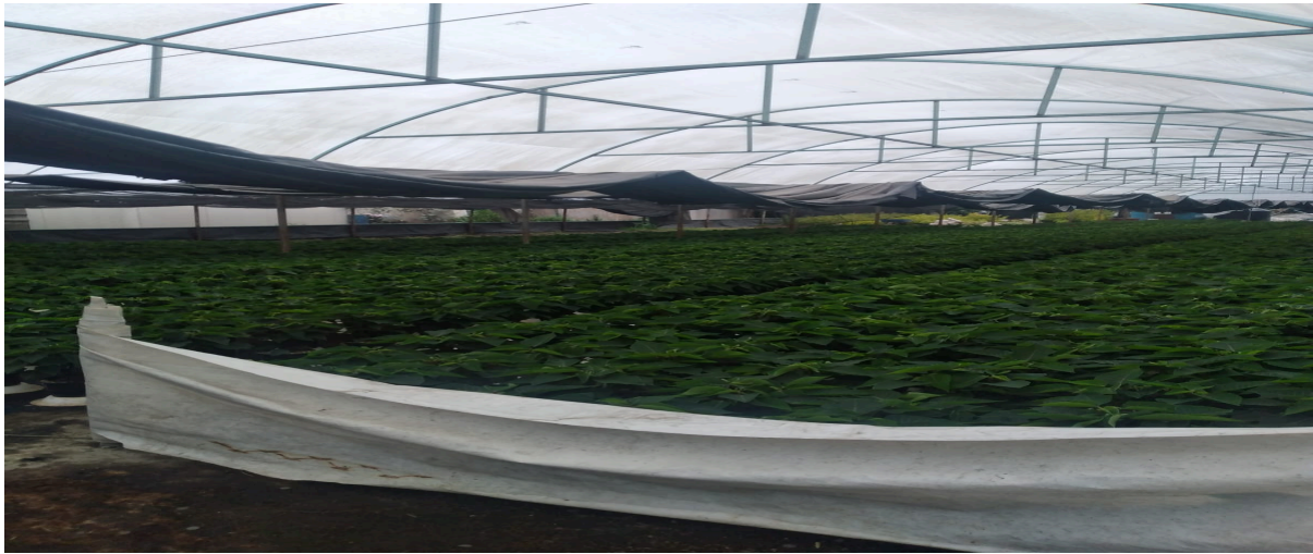
Imagen de invernadero en Caltongo de uno de los socios del palacio de la flor, en la imagen se observa cientos de plantas de noche buenas a punto de brotar.