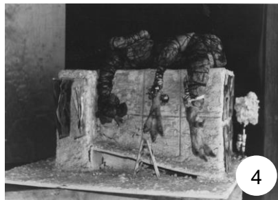
Maqueta por Juan José Gurrola. 1996.