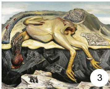
Muerte y Funerales de Caín. David Alfaro Siqueiros. 1947.