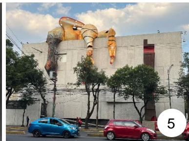
Resultado de la MACG valla en fachada. 2022.

En la pintura de Siqueiros, el animal muerto representa a Caín, y a su vez, la muerte de Caín es la muerte de la revolución, dándole un tinte de algo horrible, estúpido y cobarde.