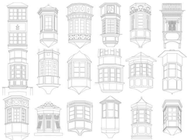
IMAGEN 3. WINDOWS OF THE WORLD COLLECTIONS

Y así se continuó hasta terminar un total de ochenta y dos detalles arquitectónicos. Después, se indicó que se debía realizar un breve escrito para indicar los elementos principales de dicho detalle, así como las características y el estilo al que pertenece.