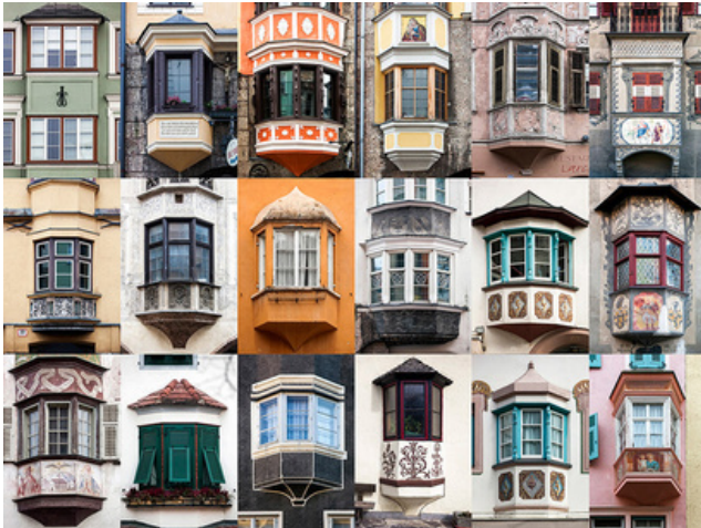
IMAGEN 2. WINDOWS OF THE WORLD COLLECTIONS