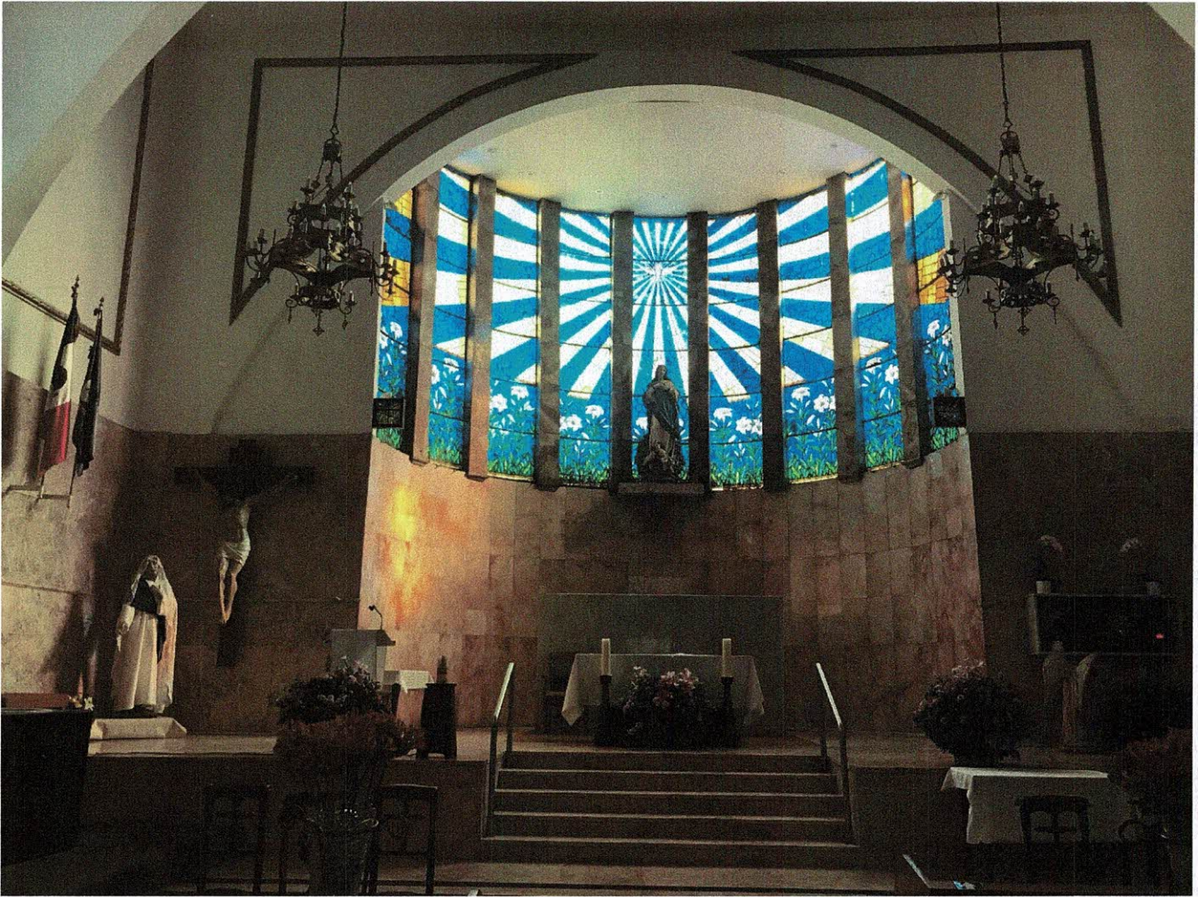
Imagen 2: Iglesia de San Antonio Clavería.