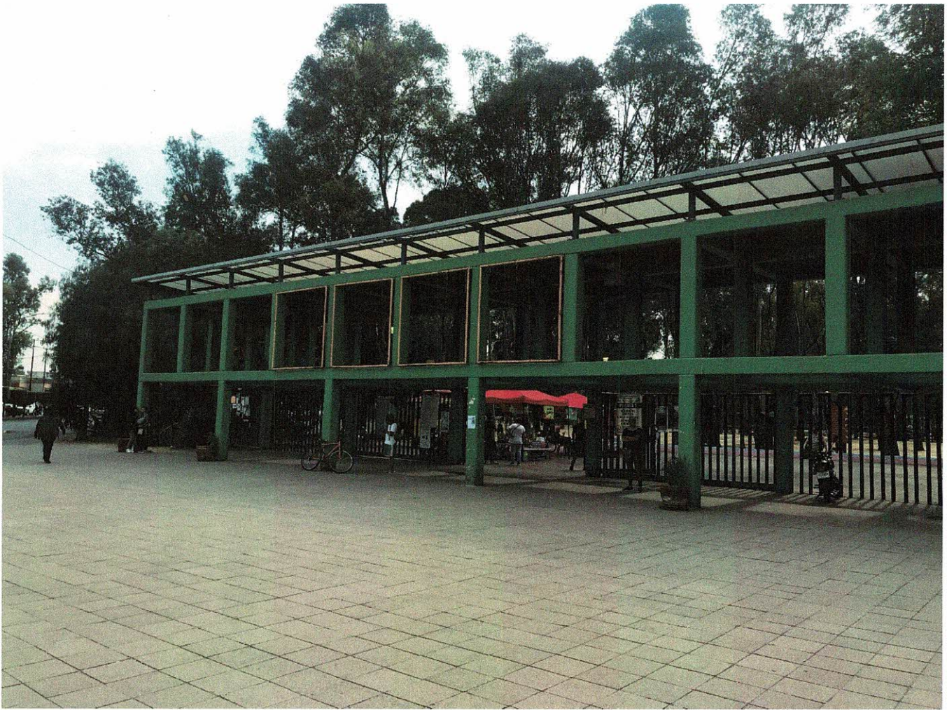
Imagen 4: Acceso Parque Tezozómoc.