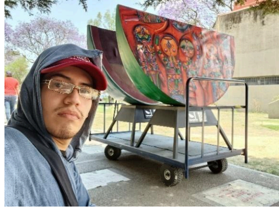
Transporte de la exposición La metamorfosis del color homenaje a Rufino Tamayo para embalaje. (24/03/2025)