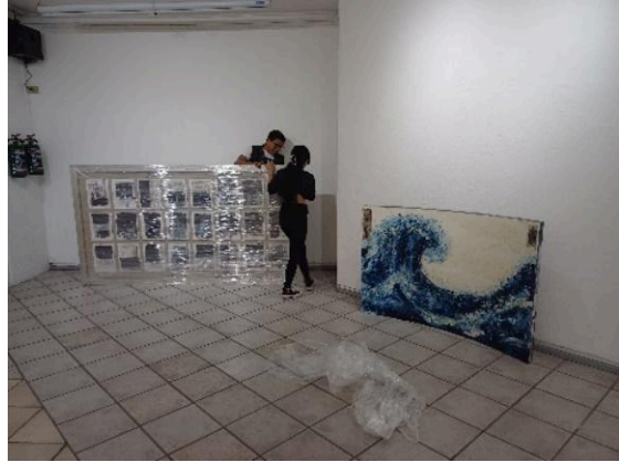
Montaje Virginia Chévez. (17/02/2025)