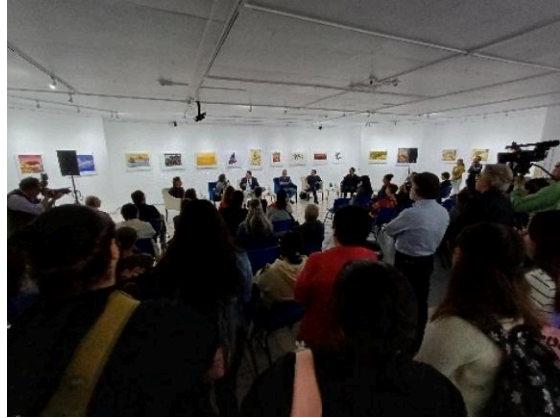
Inauguración de la exposición de Mauricio Gómez Morin: La mirada insurrecta. (23/07/2024)