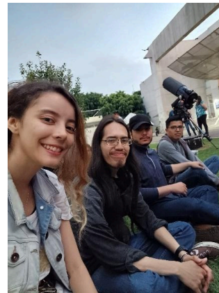
Compañeros y yo en la lunada metropolitana (23/05/2024)