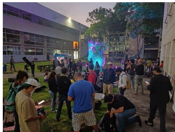
Lunada metropolitana. (23/05/2024)