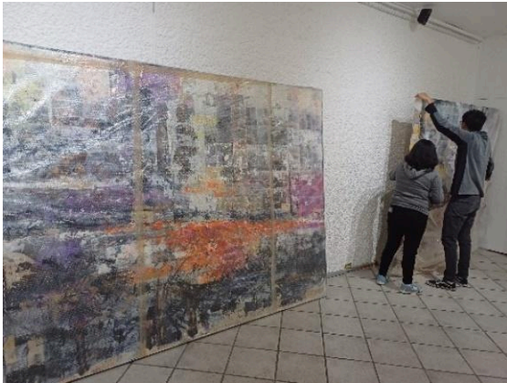
Montaje Virginia Chévez. (17/02/2025)