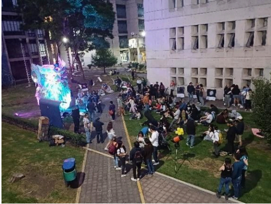
Lunada metropolitana. (23/05/2024)