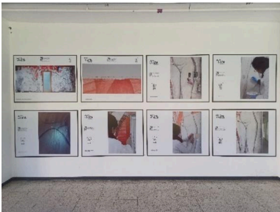
Colocación de láminas del proceso de restauración del mural de Daniel Manrique en los pasillos de la UAM Xochimilco. (11/11/2024)