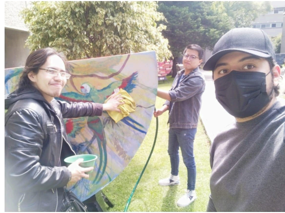
Lavado de sandías de la exposición La metamorfosis del color homenaje a Rufino Tamayo en áreas verdes de la UAM Xochimilco. (15/02/2025)