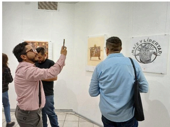
Inauguración de la exposición de Mauricio Gómez Morin: La mirada insurrecta. (23/07/2024)