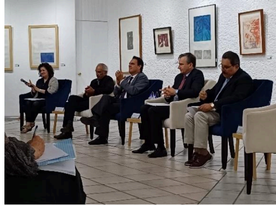
Inauguración de la exposición de Bárbara Paciorek in memoriam. (26/04/2024)