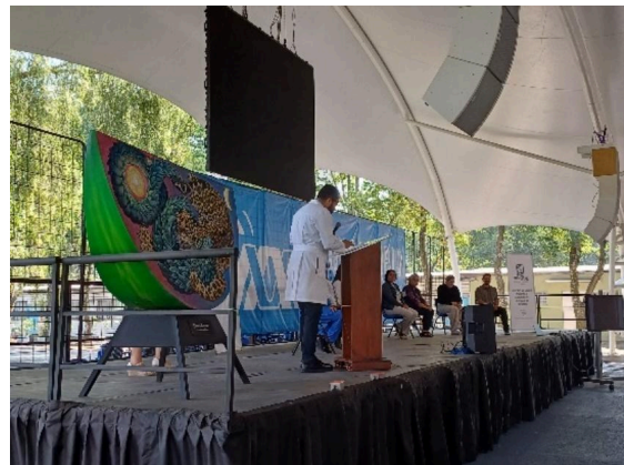
Despedida de la exposición La metamorfosis del color homenaje a Rufino Tamayo. (24/03/2025)