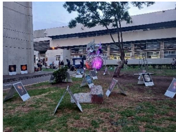
Lunada metropolitana. (23/05/2024)