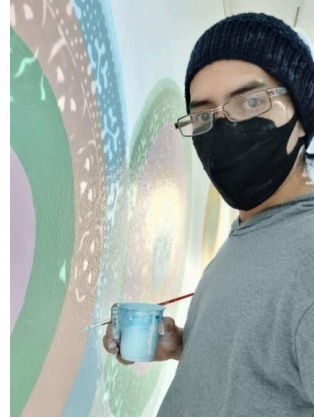
Pintando muros de la Sala Leopoldo Méndez para la exposición de Betsabeé Romero: Las sombras también migran. (22/10/2024)