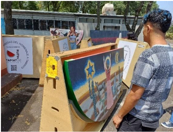
Embalaje de la exposición La metamorfosis del color homenaje a Rufino Tamayo. (26/03/2025)