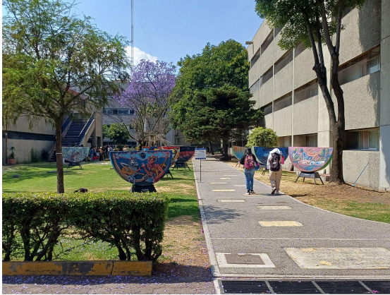
Despedida de la exposición La metamorfosis del color homenaje a Rufino Tamayo. (24/03/2025)