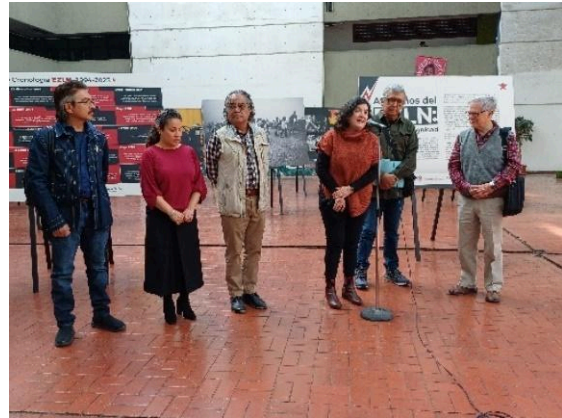
Inauguración de la exposición 30 años del EZLN: memoria y dignidad en la Plaza Roja del Edificio "A". (09/12/2024)