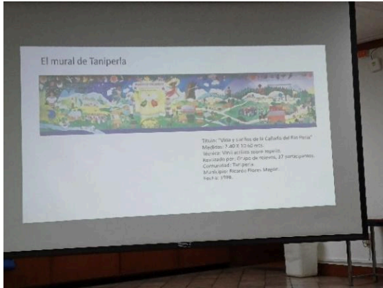
El mural de Taniperla en la presentación de 30 años del EZLN: memoria y dignidad. (09/12/2024)