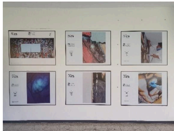
Colocación de láminas del proceso de restauración del mural de Daniel Manrique en los pasillos de la UAM Xochimilco. (11/11/2024)