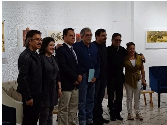
Inauguración de la exposición de Mauricio Gómez Morin: La mirada insurrecta. (23/07/2024)