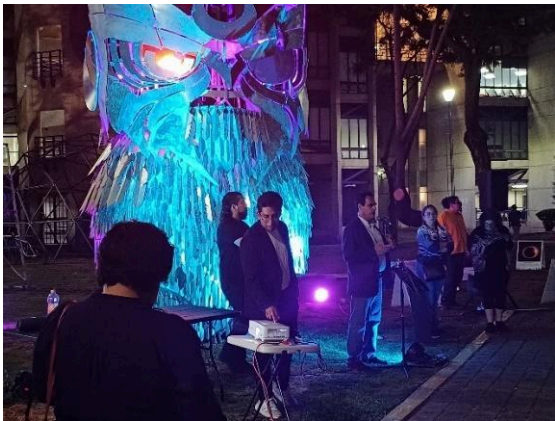
Lunada metropolitana. (23/05/2024)