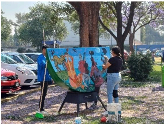
Lavado de sandías de la exposición La metamorfosis del color homenaje a Rufino Tamayo en áreas verdes de la UAM Xochimilco. (15/02/2025)