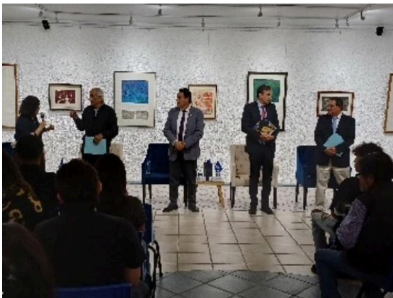
Inauguración de la exposición de Bárbara Paciorek in memoriam. (26/04/2024)