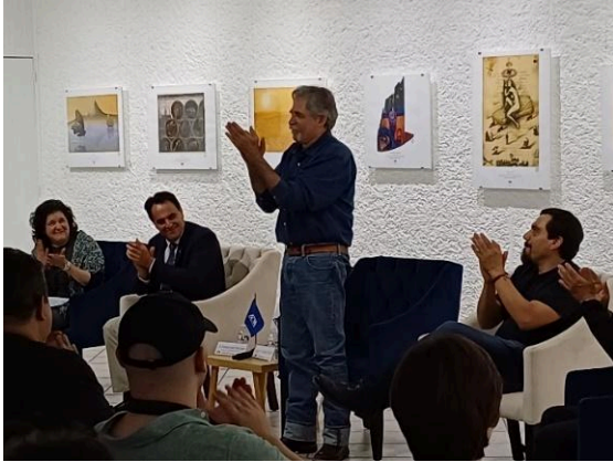
Inauguración de la exposición de Mauricio Gómez Morin: La mirada insurrecta. (23/07/2024)