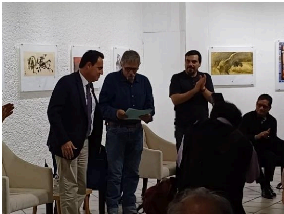
Inauguración de la exposición de Mauricio Gómez Morin: La mirada insurrecta. (23/07/2024)