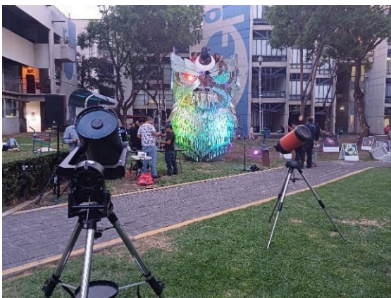
Telescopios y HUBOWL. (23/05/2024)