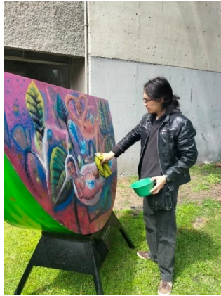
Lavado de sandías de la exposición La metamorfosis del color homenaje a Rufino Tamayo en áreas verdes de la UAM Xochimilco. (15/02/2025)