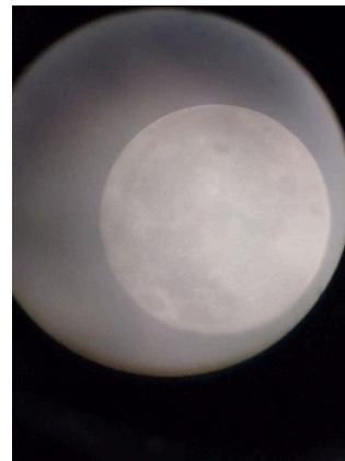
La luna a través del lente de un telescopio. (23/05/2023)