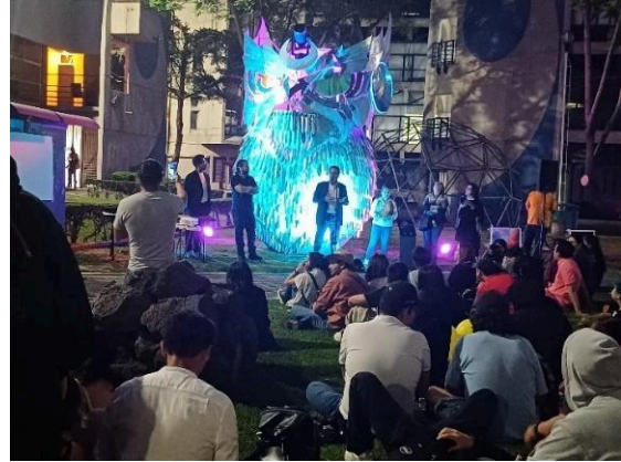
Lunada metropolitana. (23/05/2024)