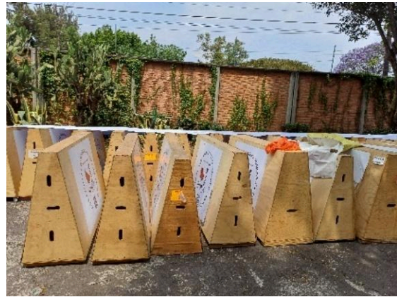
Embalaje de la exposición La metamorfosis del color homenaje a Rufino Tamayo. (26/03/2025)