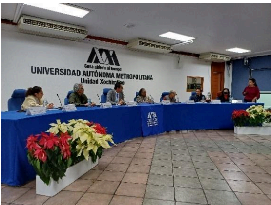
Plática de 30 años del EZLN: memoria y dignidad. (09/12/2024)