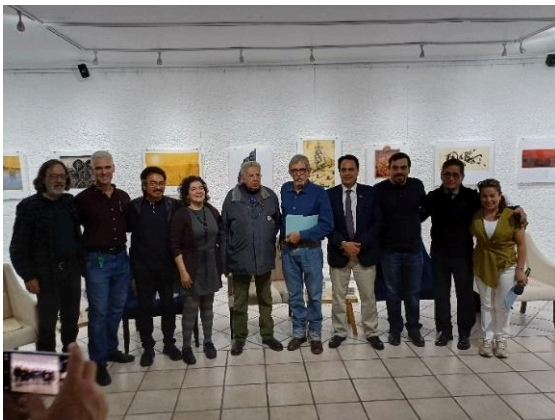
Inauguración de la exposición de Mauricio Gómez Morin: La mirada insurrecta. (23/07/2024)