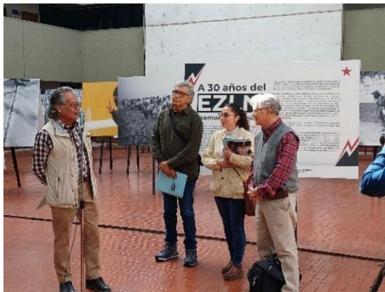
Inauguración de la exposición 30 años del EZLN: memoria y dignidad en la Plaza Roja del Edificio "A". (09/12/2024)