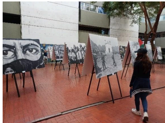
Inauguración de la exposición 30 años del EZLN: memoria y dignidad en la Plaza Roja del Edificio "A". (09/12/2024)