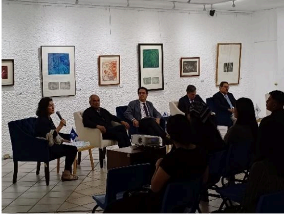
Inauguración de la exposición de Bárbara Paciorek in memoriam. (26/04/2024)