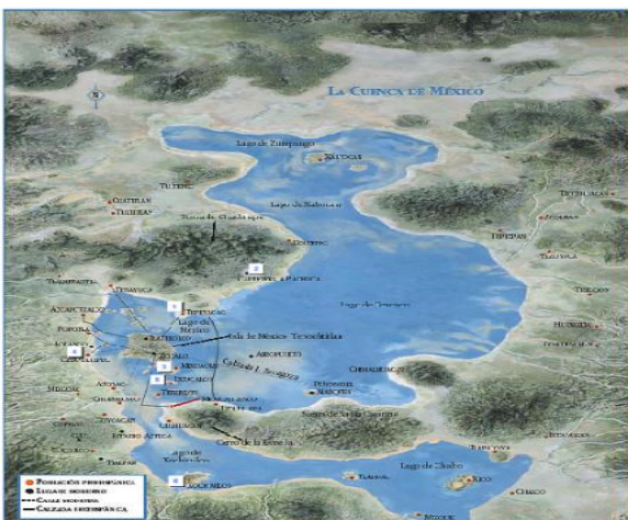
La cuenca de México antes

En síntesis, la zona central de la ciudad de México demanda agua potable, frutas y verduras y hortalizas a la zona chinampera de Xochimilco a cambio durante épocas le ha ofrecido aguas negras y más extracción hídrica.