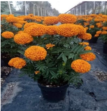
Flor de Cempasúchil

San Gregorio Atlapulco su principal actividad económica fue el cultivo de la hortaliza y la flor silvestre, por lo tanto, en sus prácticas agrícolas su principal medio fue el territorio y el agua ya que en sus chinampas cultivaban su siembra y con el agua riegan el cultivo, para ello anteriormente extraían directamente el agua de los canales ya que era agua limpia, su medio de transporte para trasladar sus productos eran por los canales y las canoas ya que el pueblo estaba constituido por canales, los hombres, tenían un papel importante ya que ellos se dedicaban al trabajo duro y pesado de las chinampas por lo cual la mujer se dedicaba al hogar.