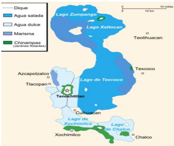
La cuenca de México ahora