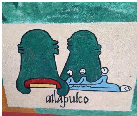
Mural del significado del agua

El pueblo de San Gregorio Atlapulco cada día se queda menos sin agua siendo un lugar que anteriormente tenía abundante agua a raíz de la creación del acueducto, el agua dejó de ser propiedad de la zona y empezó a ser de otra, por lo que, la población ya está harta de la injusticia que ha causado el gobierno, debido a esto, y la problemática del agua que pasó en el año del 2022 la población de San Gregorio Atlapulco empezó a ser protagonista de la historia de la defensa de su recurso natural que es el agua.