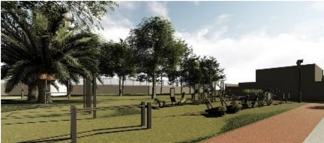
Imagen 5: Render aproximado de la zona de equipamiento, para la propuesta del proyecto Centro Deportivo de Tlaltenco, 2021