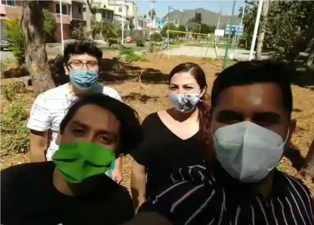
Imagen 1: Levantamiento de sitio, para la propuesta de diseño del proyecto Centro Deportivo de Tlaltenco, 2021