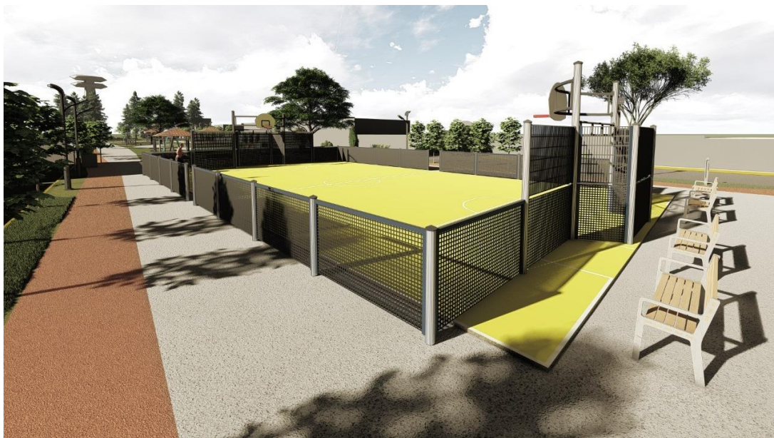
Imagen 2: Render representativo del diseño de las multi chancas del proyecto Centro Deportivo de Tlaltenco, 2021