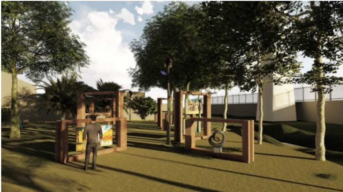
Imagen 3: Render representativo del diseño de la galería al aire libre del proyecto Centro Deportivo de Tlaltenco, 2021