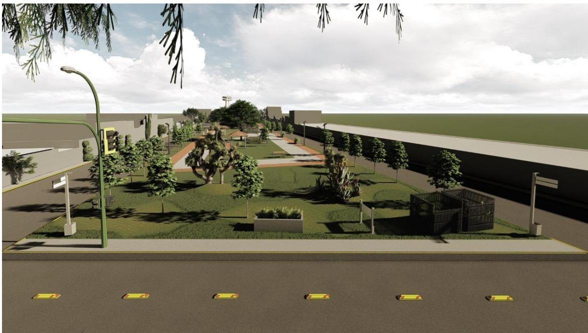
Imagen 4: Render de representativo del diseño del conjunto del proyecto Centro Deportivo de Tlaltenco, 2021