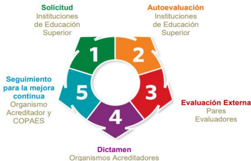
Imagen 1. Etapas del proceso de acreditación.