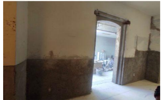
Imagen 3-6 Levantamiento para la restauracion de la biblioteca,Alcaldia Benito Juarez.

Finalmente, las últimas actividades que realicé fueron en su mayoría cotizaciones para diversos proyectos en los cuales tenía que proponer tanto mobiliario, como luminarias y materiales de acabados de pisos, muros y cancelería principalmente. La revisión de varios catálogos de conceptos fue otra de las actividades que realice en cuanto el servicio social, así como la supervisión de la obra de drenaje Fernando Anaya Monroy Col.Ermita. Después la obra de pozos el cual se tenían diversos puntos de vista por parte de la alcaldía ya que la obra se tuvo que detener pero se visitó en cuanto se realizaba. E n ocasiones, complementamos este enfoque con visitas presenciales para tomar fotografías detalladas y realizar pequeños levantamientos, garantizando la obtención de información precisa. Las imágenes recopiladas se incorporaron al programa AutoCAD para su proyección digital.