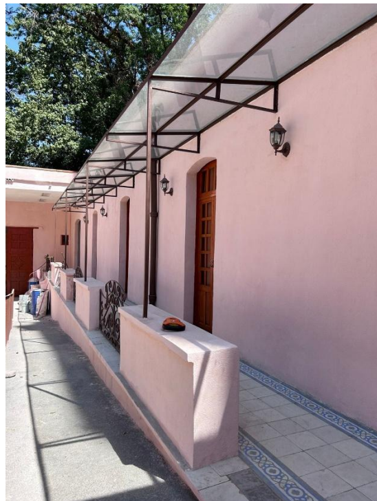
Imagen 7,8 restauracion de la biblioteca,Alcaldía Benito Juarez.