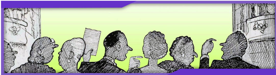
Slide, El debate, Enero 2024, Fotomontaje, Alexis Solano