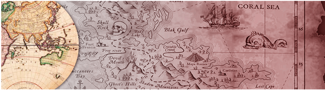
Slide, El viaje de la creación, Noviembre 2023, Fotomontaje, Alexis Solano