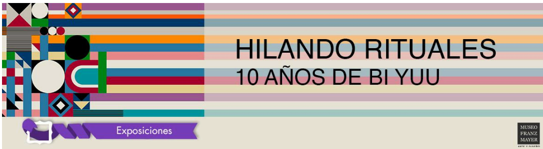
Banner para home, Hilando rituales, Octubre 2023, Adaptación Promocional, Museo Franz Mayer