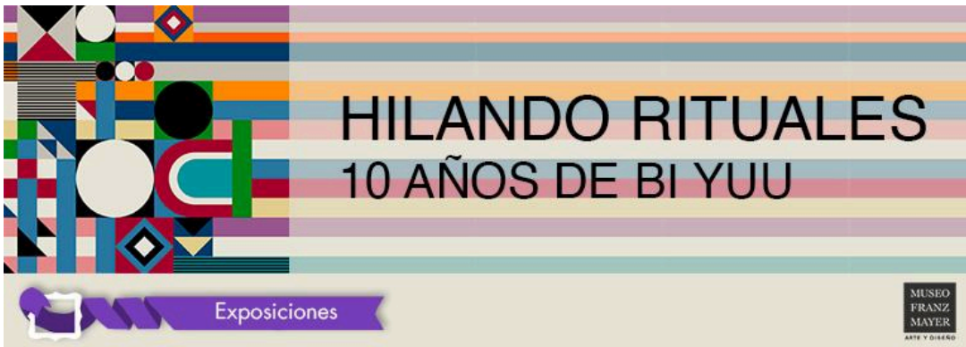
Banner para aplicación, Hilando rituales, Octubre 2023, Adaptación Promocional, Museo Franz Mayer