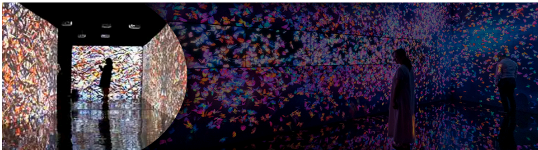
Slide, Expresionismo abstracto, Diciembre 2023, Fotomontaje, Alexis Solano