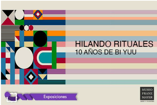
Banner para móviles, Hilando rituales, Octubre 2023, Adaptación Promocional, Museo Franz Mayer