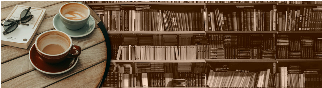
Slide, Tardes literarias, Agosto 2023, Fotomontaje, Alexis Solano