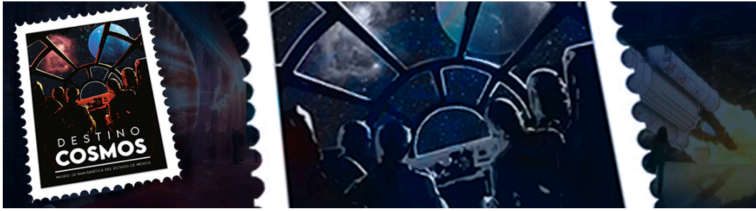
Slide, Destino cosmos, Septiembre 2023, Fotomontaje, Alexis Solano