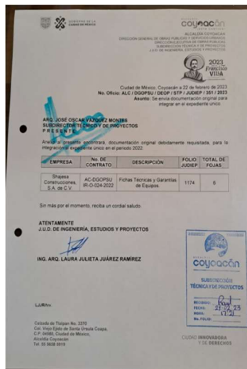
Oficios realizados y entrega de documentación.