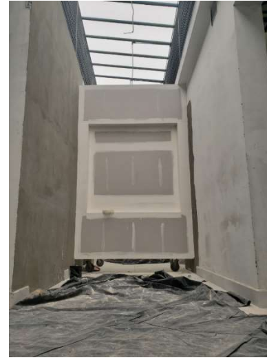
Nicho para remate visual.