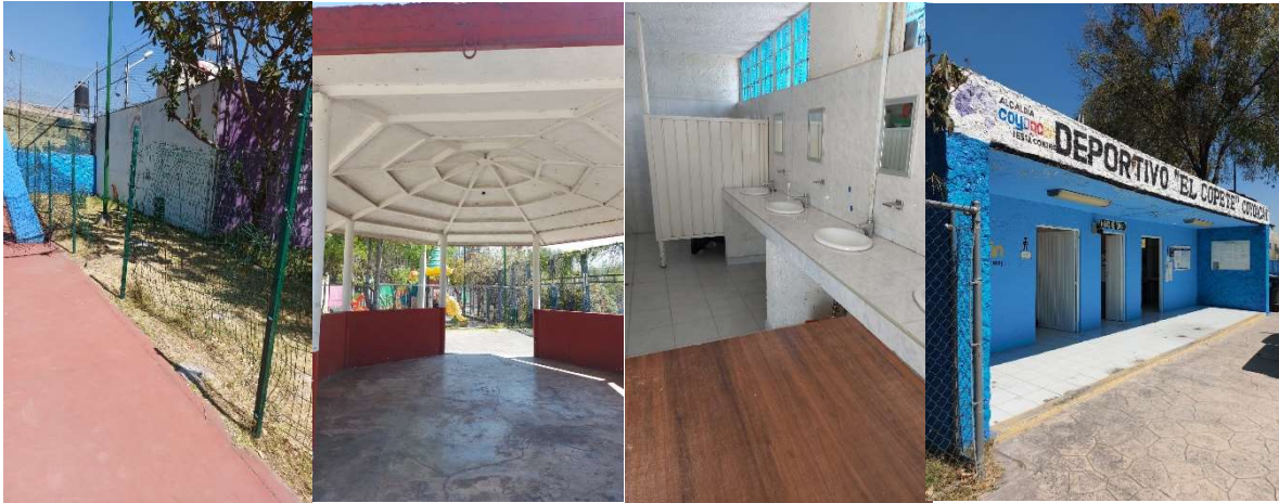
Cambio de malla