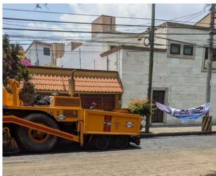
Tendido de carpeta asfáltica y mejor granulado de la carpeta.