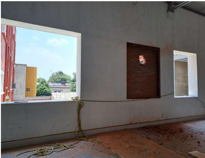
Levantamiento de ventanas para modificar en planos de las fachadas.