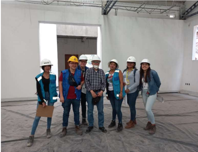
Recorrido para conocer y saber el progreso de la obra (edificio remodelado) con la supervisión, la constructora y residente de obra.