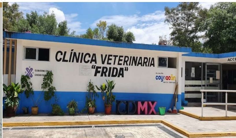
Fachada inicial sin intervenir.