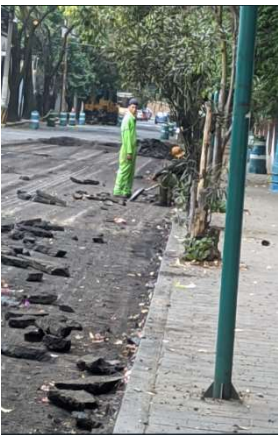
Retiro de excedente por medios manuales