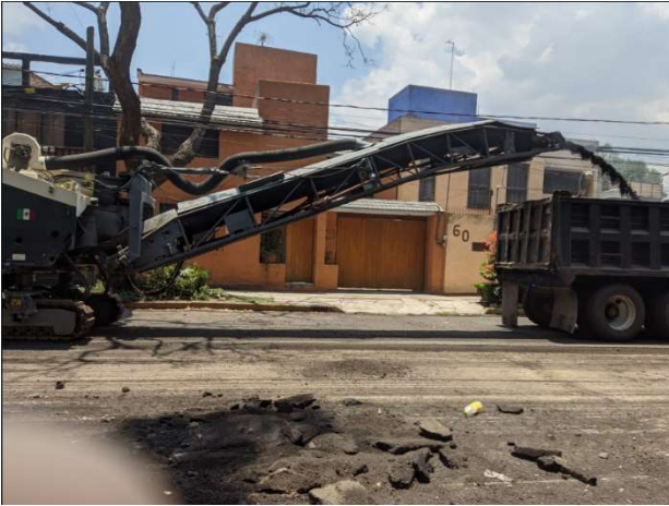
Fresado, retiro del asfalto.