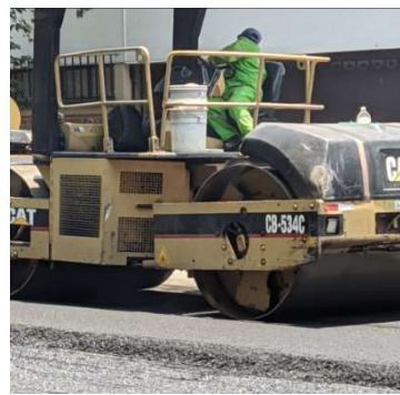
Aplanado y compactación de carpeta.