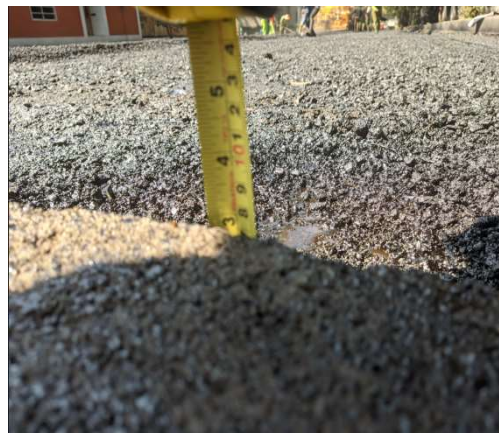
Capa de excavación para carpeta asfáltica de 7.5cm y final de 9cm.