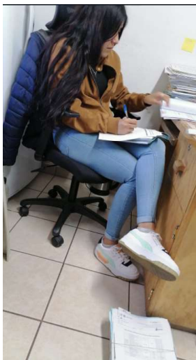
Conteo de generadores y revisión de estimaciones.