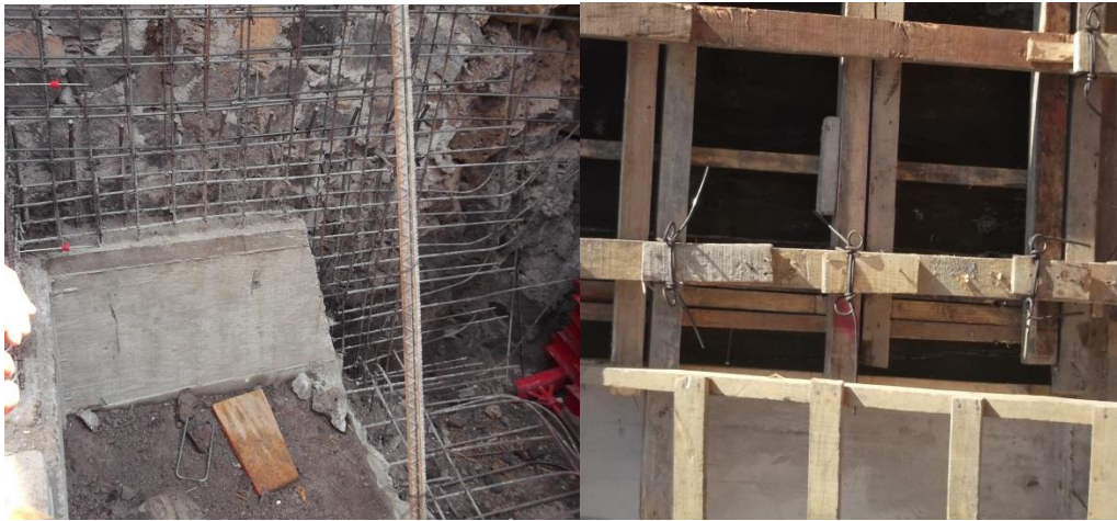
Foto tomada en una de las esquinas del terreno donde se puede notar las varillas que se utilizaron para el armado, en la otra podemos notar todavía como se colocó la cimbra para el colado la cual está sujeta con alambren del cual desconocemos el calibre de este, en algunas partes la cimbra no se pudo recuperar ya que quedó del lado que está continuo al terreno adyacentes y por lo cual es muy difícil retirar la cimbra de madera.

El terreno se está trabajando por zonas y por consiguiente se lleva un ritmo distinto de obra, en unas partes todavía se realiza excavación y en otras se están llevando a cabo trabajos de colado y levantamiento de columnas.