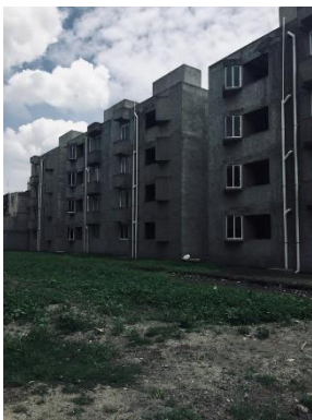
Imagen 2 Unidad Habitacional Francisco Javier Mina

TLáhuac, los trabajos realizados en estas oficinas son de carácter administrativos, pero también se realizan los proyectos ejecutivos de las obras de las que se encarga la asociación, mi aporte constaba en realizar algunas correcciones de planos sobre los proyectos a cargo, así como la realización de planos arquitectónicos, detalles de herrería, instalaciones e isométricos de las instalaciones, además de esto, también realice trabajos de búsqueda, clasificación y archivo de documentos.