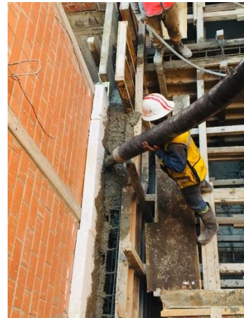
Imagen 23 Colado de cisternas, U. H. Canal de Chalco 598.