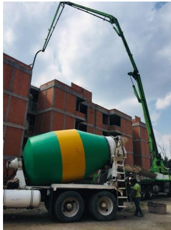
Imagen 23 Maquinaria para el colado de cisternas, U. H. Canal de Chalco 598.