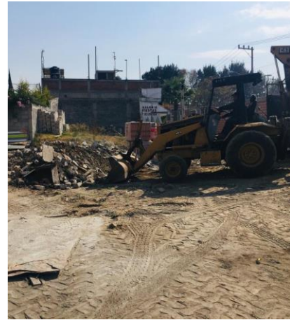
Imagen 9 Acarreo de material de demolición