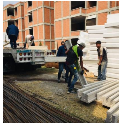
Imagen 20 Descarga de material (viguetas y bovedilla), U. H. Canal de Chalco 598.