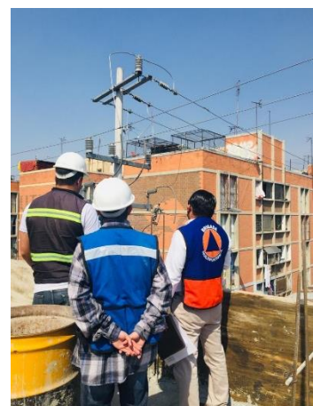
Imagen 17 Recorrido con personal de CFE para evaluar las medidas de seguridad a tomar