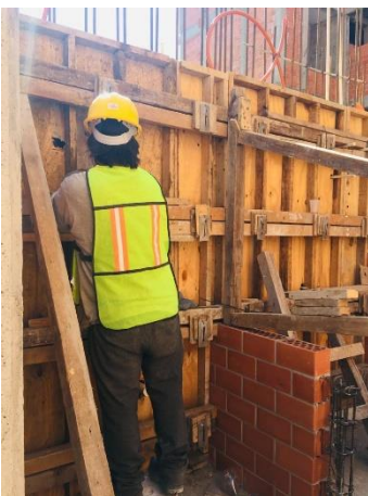
Imagen 17 Cimbrado de muros, U. H. Canal de Chalco 598.