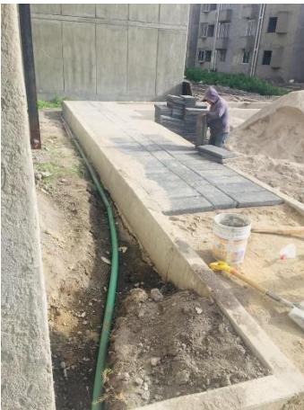
Imagen 14 Colocación de adocreto en andadores, U. H.