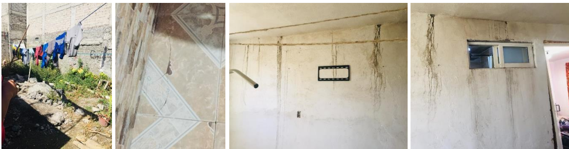
Imagen 6 Levantamiento de predios, casos de reconstrucción

Una de las últimas actividades que realicé en mi servicio fue un caso de reconstrucción, primero realicé visitas a algunos predios que sufrieron daños por los sismos ocurridos en el 2017, elaborando levantamientos arquitectónicos. Fui encargada de elaborar un proyecto completo, de reconstrucción de una casa que sufrió daños en algunos muros, desprendimiento de loseta en pisos, y la elaboración de una habitación nueva, así como de un baño, elaboré planos arquitectónicos, estructurales, de instalaciones, acabados y algunos detalles para el refuerzo de los muros afectados, también elaboré el presupuestador de obra y el catálogo de partidas de acuerdo a los parámetros que el INVI establece, si bien yo realicé el proyecto por completo, tuve la asesoría de uno de los arquitectos a cargo. Al ser apoyo de uno de los asesores también tuve la oportunidad de aprender a realizar las bitácoras de obra y por consecuente los finiquitos de los mismos proyectos.