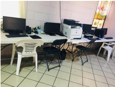
Imagen 1 Oficinas Jar´uajparin.

La asociación con quien realicé mi servicio social, tiene oficinas dentro de la unidad habitacional Ceani, ubicada en calle gitana no. 331, en colonia Del Mar, en la alcaldía