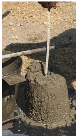
Imagen 20 Prueba de revenimiento, U. H. Canal de Chalco 598