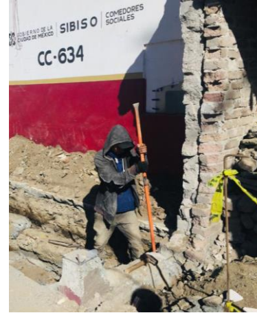
Imagen 12 Demolición de barda perimetral antigua