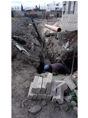
Imagen 14 Excavación para fabricación de registros sanitarios, U. H. Javier Mina.

Nota: Todas las fotografías de este archivo, fueron tomadas por mi durante el servicio social.