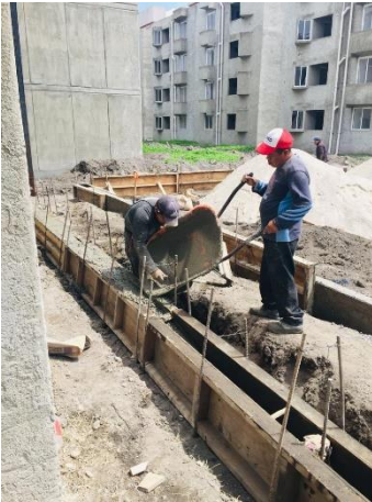
Imagen 9 Colación de guarniciones, U. H. Javier Mina