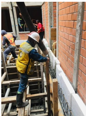
Imagen 17 Colado de cisternas, U. H. Canal de Chalco 598.