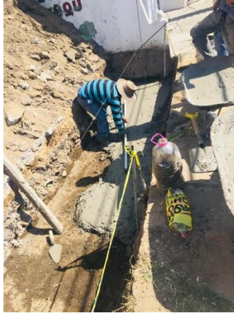
Imagen 12 Fabricación de plantilla de concreto para cimentación de la barda perimetral, U. H. Javier Mina