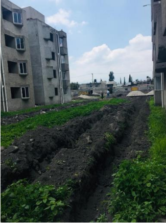
Imagen 12 Zanja para guarniciones exteriores, U. H. Javier Mina.