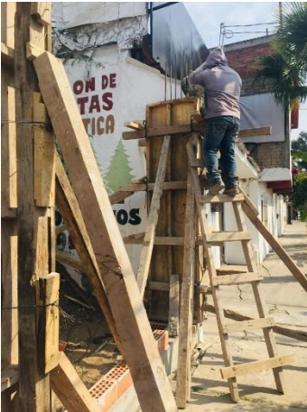
Imagen 9 Colado de castillos de barda perimetral, U. H. Javier Mina