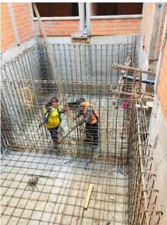
Imagen 20 Armado de muros de cisterna, U. H. Canal de Chalco 598