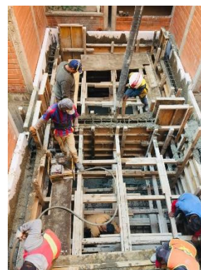
Imagen 5 Colado de cisterna en U. H. Canal de Chalco 598

Dentro de las visitas a esta obra en particular, tuve la oportunidad de presenciar el colado de la cimentación y los muros de dos cisternas, la cimbra utilizada para este colado era a base de madera, y para los espacios en donde no se podría recuperar la cimbra, se optó por utilizar placas de poliestireno; el poder ver todo lo que conlleva realizar el colado fue una experiencia muy satisfactoria, presencie desde que las ollas llegaron a la obra, las pruebas de revenimiento, el vaciado del concreto por medio de maquinaria y el vibrado del concreto para que la estructura obtuviera la compactación requerida, para así poder contar con la resistencia adecuada y las menores imperfecciones posibles en el acabado.