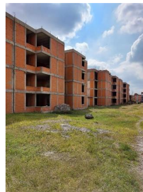
Imagen 4 Unidad Habitacional Canal de Chalco 598.

A su vez apoyé en la organización de remisiones sobre el material recibido en obra, y la cuantificación de lo ya utilizado, para poder hacer la solicitud del material faltante, también participe en la modificación del calendario de obra, debido a un atraso en los trabajos del frente sur; por seguridad para los trabajadores se suspendió los trabajos debido a que la construcción estaba por alcanzar altura de los cables de tensión y era peligroso trabajar así, se realizó la respectiva solicitud a CFE para tomar las medidas necesarias, en este caso un reacomodo en los postes de luz, que actualmente se encuentra en proceso.