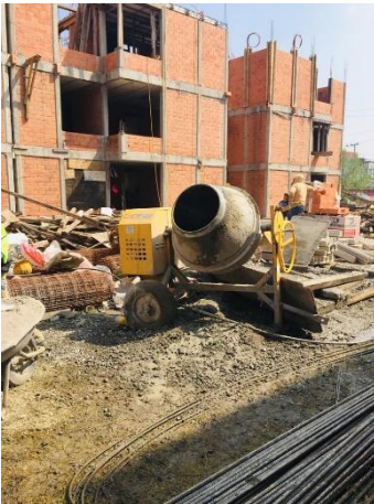
Imagen 23 Elaboración de concreto en obra, para colado de bases de tinacos, U. H. Canal de Chalco 598