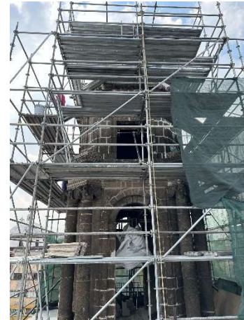
Imagen 2. Supervisión de obra del Templo de San Pablo Apóstol (El Nuevo)