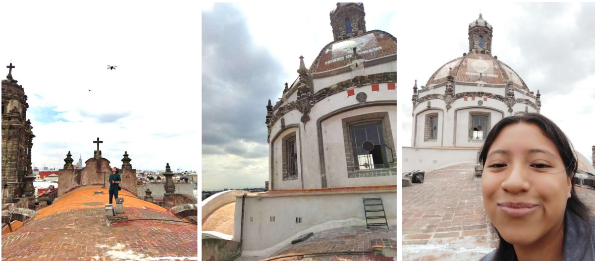
Imagen 13, 14 y 15. Visita al templo de la Santísima Trinidad.

Otro templo que pude visitar cuando la empresa entregó la obra fue el templo de la Santísima Trinidad , en él se llevaron a cabo los procedimientos para la reestructuración de la cúpula y las bóvedas del transepto, los trabajos en el inmueble fueron enfocados a la intervención estructural. Tuve la oportunidad de acompañar al Arq. Eduardo Lizama para tomar capturas de las afectaciones restantes mediante vuelo de dron ( imagen 13 y 14 y 15 ).