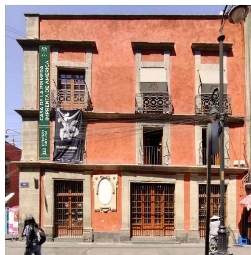
Imagen 4. Superposición de pendón aprobado en fotografía de la fachada sur, sobre calle Moneda