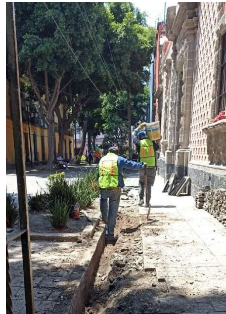
Imagen 6. Supervisión de avances en obra de la rehabilitación del Callejón de Ecuador.

Acompañé a los arquitectos en el seguimiento de los avances de obra del callejón ( imagen 6 ) para tomar las fotografías necesarias y documentar la visita de supervisión. En este proyecto también apoyé en la revisión de números generadores, que el FCHCM recibe por parte de la empresa encargada de realizar la obra.