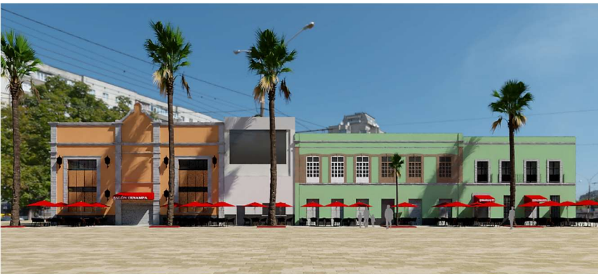
Imagen 11. Imagen objetivo de propuesta de toldos nominativos y enseres, elaborada en skp y vray. (Sección de la cuadra del restaurante “El Tenampa”).

Se me asignó un cuadrante para trabajar los planos de fachada de estado actual, para luego, generar larguillos y corroborar con la base de datos las dimensiones de los toldos y su giro actual. Posteriormente a generar la planimetría de estado actual, la Arq. Adriana Chávez desarrolló la propuesta de los nuevos toldos y se nos solicitó generar imágenes objetivo ( imagen 11 ) de los inmuebles con la propuesta de toldos y los enseres propuestos por la Autoridad del Centro Histórico, para elaborar una presentación dirigida a los locatarios de la Plaza Garibaldi ( Imagen 12 ).