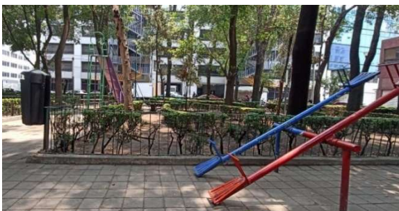
Imagen 7. Levantamiento de Parque San Salvador el Verde

Se realizó un levantamiento del parque ( imagen 7 ), ubicado en el perímetro B del Centro Histórico de la Ciudad de México, entre la calle San Salvador el verde no. 7 y callejón san Salvador el Verde. Apoyé, de manera conjunta con mi compañera de s.s., al