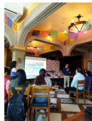
Imagen 12. Día de la presentación a locatarios.