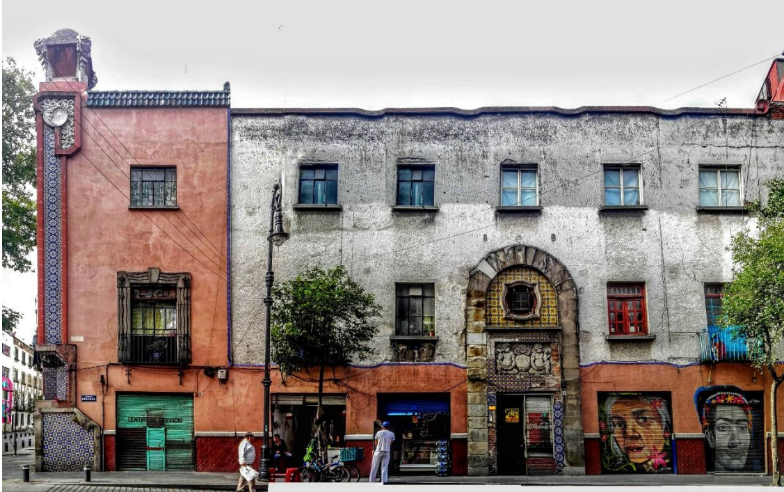
-Fachada Principal Brasil 74