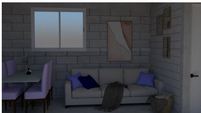
Vivienda Campeche 40 m 2