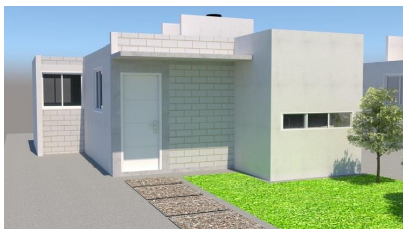
Vivienda Campeche 52 m 2