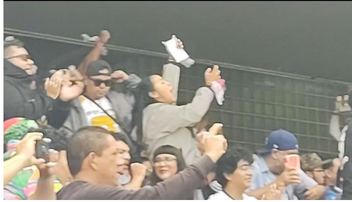
Fotografía 5. Elaboración propia. 09/ 09/ 2024. Estadio Olímpico Universitario, Ciudad de México.

Se pita penal a favor de Pumas, y la afición festeja bastante fuerte. Cae el tercer gol de Pumas, y la afición explota, esto porque el marcador se coloca favorable; realmente está siendo un partidazo y ahora estoy considerando en sí acercarme un poco más a la barra del equipo, bueno, por el momento me dispongo a terminar de ver el primer tiempo.