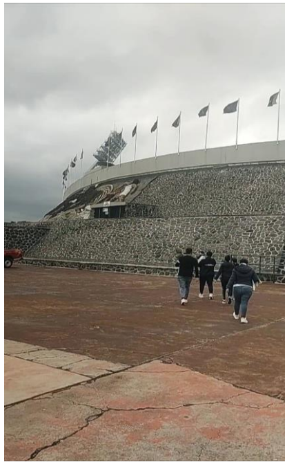
Fotografía 1. 09/09/2024. Estadio Olímpico Universitario, Ciudad de México.

En las afueras del estadio, me percaté de algunos miembros de la barra de pumas tomando esa ubicación como punto de encuentro para reunirse, supongo que a modo de que entren los máximos posibles juntos. Mi primo y yo nos dirigimos a la entrada del estadio, el cual transmite imponencia, y a pesar de que ya he ido a ese estadio algunas otras veces, nunca voy a dejar de sentir lo enorme que se ve.