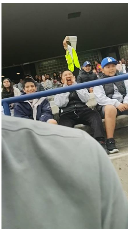
Fotografía 4. Elaboración propia. 09/ 09/ 2024. Estadio Olímpico Universitario, Ciudad de México.

El penal termina en gol de Atlas, por lo que empata el encuentro, la reacción de la afición puma fué de gritos y abucheos, dirigidos al árbitro. Cae el segundo gol de Atlas, esto, unos pocos minutos luego del primer gol, el marcador va 1-2 a favor de la visita, observo a la grada y se nota un silencio incómodo, y una leve sensación de derrota, esto dura poco, porque un aficionado comienza a realizar un cántico de apoyo al cual la afición se une y se reavivan los sentimientos grupales y de esperanza. ¡Gol de pumas! empata el marcador unos pocos minutos después del gol de Atlas, esto se está convirtiendo en un partidazo, ya que tan solo es el primer tiempo, la reacción de la afición es de efusividad, se nota la diferencia de emoción, comparando el primer gol a favor, ahora percibo cánticos como el famoso Goya, del cual no estoy siendo participe, ya que mi participación en esta observación participante es pasiva, aunque realmente quería cantar, porque como lo mencionaba, soy aficionado de los Pumas.