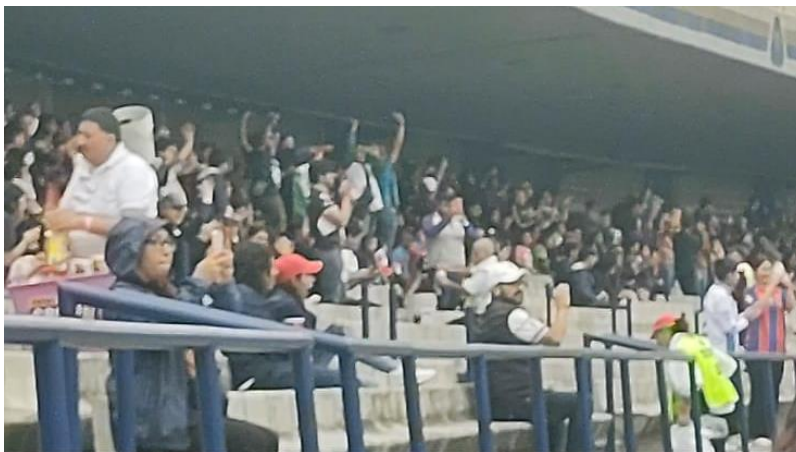
Fotografía 7. Elaboración propia. 09/ 09/ 2024. Estadio Olímpico Universitario, Ciudad de México.

siguen gritando cosas, tanto buenas como malas, hace unos pocos minutos estaban gritando cosas entorno a la belleza de la portera del equipo, ahora están gritando cosas ofensivas a las jugadoras de Atlas, entorno a que no son buenas; realmente puedo observar que el fútbol presenta muchas formas de violencia, tal vez se pasan por desapercibidas, algunas manifestaciones de esto, pero me resulta un poco inquietante el hecho de que unos niños utilicen el fútbol como medio para violentar. Cae el cuarto gol de Pumas, este gol está sonando más fuerte, yo pienso que es por dos razones, la primera es porque el partido se estaba tornando aburrido y cae un momento de felicidad colectiva, la segunda es que el gol fué bastante bueno, dejando a la afición con un agradable sabor de boca y un resultado de 4-2.