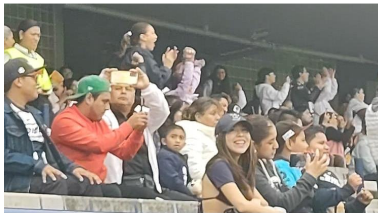
Fotografía 6. 09/ 09/ 2024. Estadio Olímpico Universitario, Ciudad de México.

Se pita penal a favor de Pumas, y la afición festeja bastante fuerte. Cae el tercer gol de Pumas, y la afición explota, esto porque el marcador se coloca favorable; realmente está siendo un partidazo y ahora estoy considerando en sí acercarme un poco más a la barra del equipo, bueno, por el momento me dispongo a terminar de ver el primer tiempo.