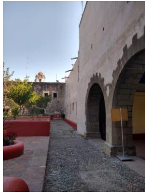
Museo Nacional de las Intervenciones