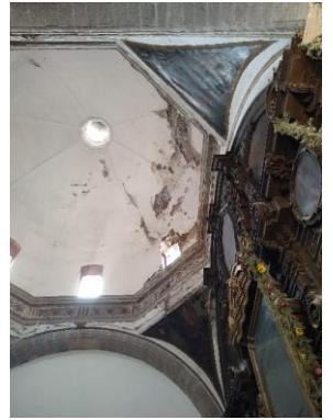
Capilla del Peñón de los Baños