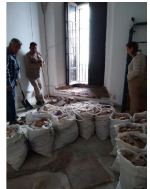
Museo Nacional del Virreinato Tepotzotlán