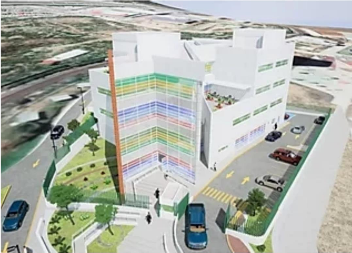
Fig. 2 Revisión de memoria técnica y descriptiva del proyecto Centro de Investigaciones en Biomédicina Molecular, Zacatecas, Zac.