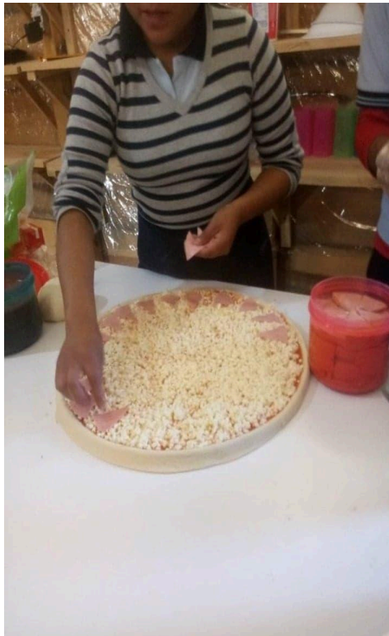
Proyecto comunitario de pizzería. 5