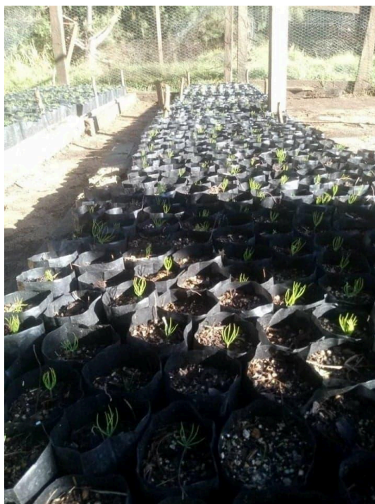
Proyecto de hortalizas, 2019. 8

La adquisición de estos conocimientos básicos y técnicos operativos responde a los alumnos que no quieran seguir estudiando para que tengan una incorporación al mercado del trabajo con ventaja competitiva, al dominar conocimiento y técnicas de trabajo productivo. El MEII propone su agrupación de áreas y campos de conocimiento de la siguiente manera: 1. Humanidades, 2. Lenguas y comunicación, 3.Ciencias sociales, 4.Ciencias naturales, 5.Matemáticas, 6.Metodología de la investigación, 7.Escuela y comunidad, 8.Expresión,creatividad y desarrollo físico.