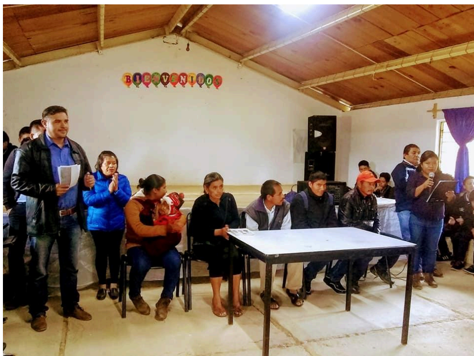
Directivos, comité de padres y del albergue dando bienvenida a alumnos. 12

prevención de embarazo en adolescentes y violencia en el noviazgo en el BIC.