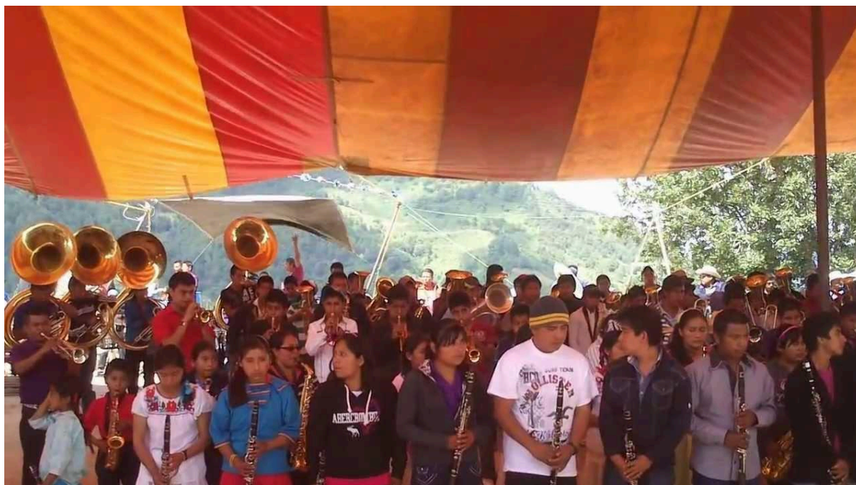
Jóvenes participando en concursos de bandas, Tepuxtepec 2018. 2

El Colegio Superior para la Educación Integral Intercultural de Oaxaca (CSEIIIO) ha tratado de que toda la sierra norte intervenga y represente sus tradiciones. El 18 de febrero del 2019 Tepuxtepec recibió la invitación a participar en el día internacional de lenguas indígenas donde participaron llevando un poco de sus platillos como el caldo mixe e interpretaron números musicales y de danza. Aunque el CSEIIIO busca el rescate de las lenguas muchos jóvenes que ingresaron al bachillerato en el 2019 ya no hablan mixe lo que ha llevado a que no puedan comunicarse con su misma comunidad, los abuelos principalmente, ya que muchos adultos sólo hablan su lengua madre esto provocando que las relaciones familiares y los conocimientos de la gente adulta en cuestión de tradiciones, cultura y leyendas ya no se rescaten, y posiblemente se pierdan.