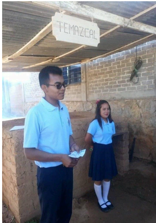
Presentación de temazcal. 7

gran parte de la escuela ya que se les involucró a poner hortalizas, colocar flores y cuidar los espacios verdes.