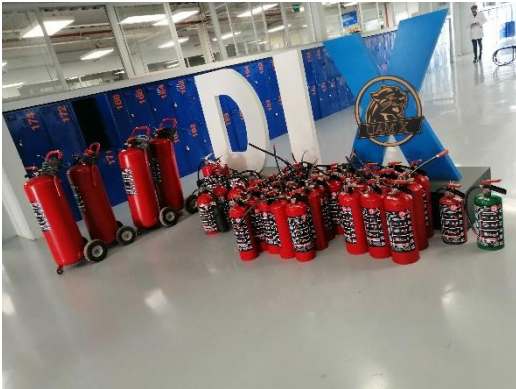
Ilustración 13 abril 2022, recibimiento de extintores