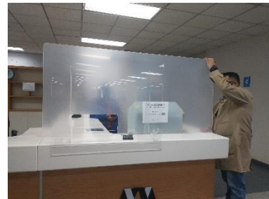
Ilustración 3 diciembre 2021, colocación de mamparas acrílico