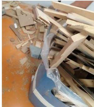
Ilustración 1 noviembre 2021, Limpieza de taller de maderas