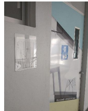
Ilustración 6 febrero 2022, colocación de porta hojas en salones.