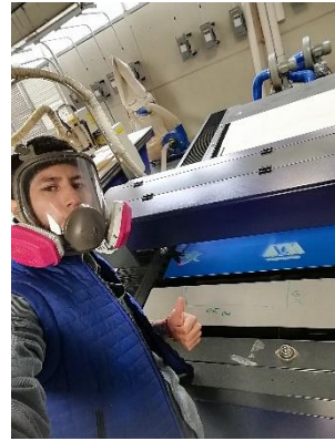
Ilustración 12 marzo 2022, grabado de carteles.