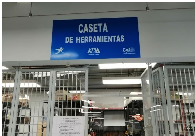
Ilustración 16 abril 2022, colocación de cartel en caseta de herramientas.