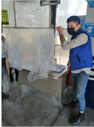
Ilustración 11 marzo 2022, mampara para entrada de hueso.