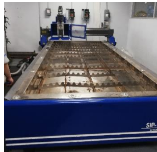
Ilustración 5 enero 2022, recibimiento corte plasma.