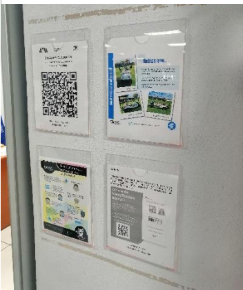
Ilustración 15 abril 2022, colocación de porta hojas en jefatura de talleres.