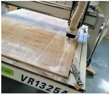
Ilustración 2 noviembre 2021, Corte de acrílicos.