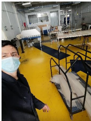
Ilustración 7 Febrero Recuperación de material acrílico.