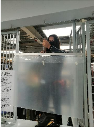
Ilustración 10 marzo 2022, Mampara colgante en caseta de herramientas.