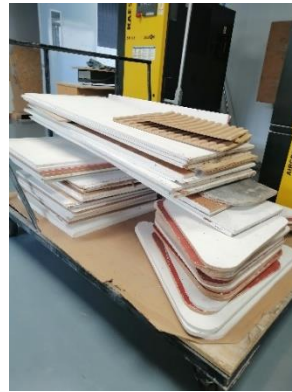
Ilustración 14 marzo 2022, traslado de aglomerado.