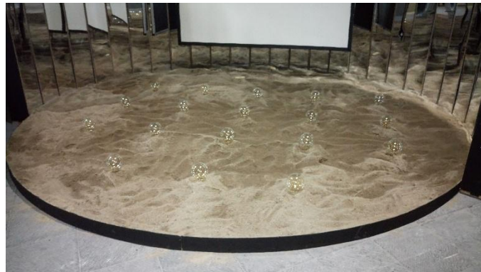
3 Instalación de arena

su limpieza, la pintura de cables y retoques. Del otro lado de la sala se creó una instalación que simulaba el experimento que realizó Tesla dando energía a bombillas enterradas en el piso por medio de la transferencia inalámbrica de electricidad. En este caso, fui la encargada de coordinar el arribo de la arena con seguridad del CENART y su traslado a la galería.