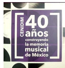
1 Hoja de sala de la exposición

En la cuarta galería, la cual está ubicada al interior de la biblioteca de las Artes se llevó a cabo el montaje de una exposición por parte del CENIDIM, Centro Nacional de Investigación, Documentación e Información Musical. La muestra fue parte de la celebración de los 40 años de esta institución y por lo tanto hablaba de su trayectoria desde sus orígenes. El apoyo a este proyecto fue menor ya que un despacho externo genero tanto la museografía como las vitrinas y demás mobiliario museográfico. Se requirió el aporte de herramienta y de dos bases para un sitio de consulta que se instaló al final de la exhibición. Cabe hacer notar que un aprendizaje importante para mí con esta exposición se basó en las dificultades que surgen de ser un espacio en una biblioteca, pues no son las mismas facilidades a otros espacios y puede resultar difícil lidiar con esas áreas.