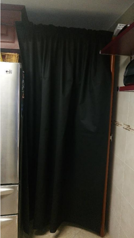
7 Cortina terminada para accesos

exposiciones. Días previos a mi incorporación a la institución se llevó a cabo una muestra complementaria a la feria del libro, FILIJ, en las instalaciones de la Esmeralda. En ella se utilizaron varios metros de tela negra para lograr el