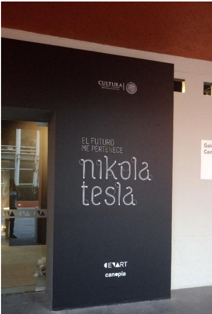
Rotulo fuera de Galería Central

El montaje de la exposición terminó con coordinar el resguardo de las cajas de embalaje de esta en la bodega en conjunto con los estibadores. También se supervisó la limpieza y toques finales previos a la rueda de prensa y apertura. Y claro está, con la inauguración de la muestra. En esta última se apoyó en el movimiento de bases para una demostración de bobinas de tesla que disfrutó el público después de la ceremonia.