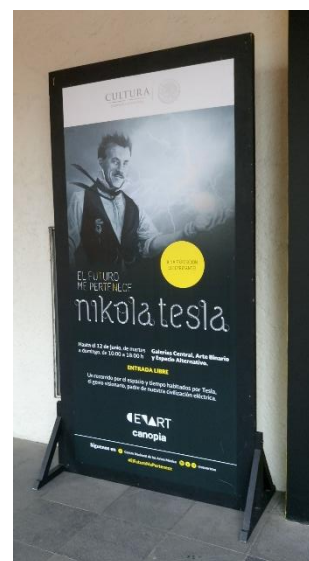
2 Cartel de la exposición Nikola Tesla

En el mes de febrero se terminaron las modificaciones a las galerías para el montaje de la siguiente exposición. Durante la reconstrucción apoyé en la supervisión de los tiempos planeados y en los acabados de estos. Esta exhibición es un proyecto que viene de España, gracias a una compañía de cultura: Canopia, que se presentó primero en Monterrey con mucho éxito y se trajo al CENART. Trata dar a conocer más de la vida y logros de un gran pensador que no es tan promovido como debería, Nikola Tesla.