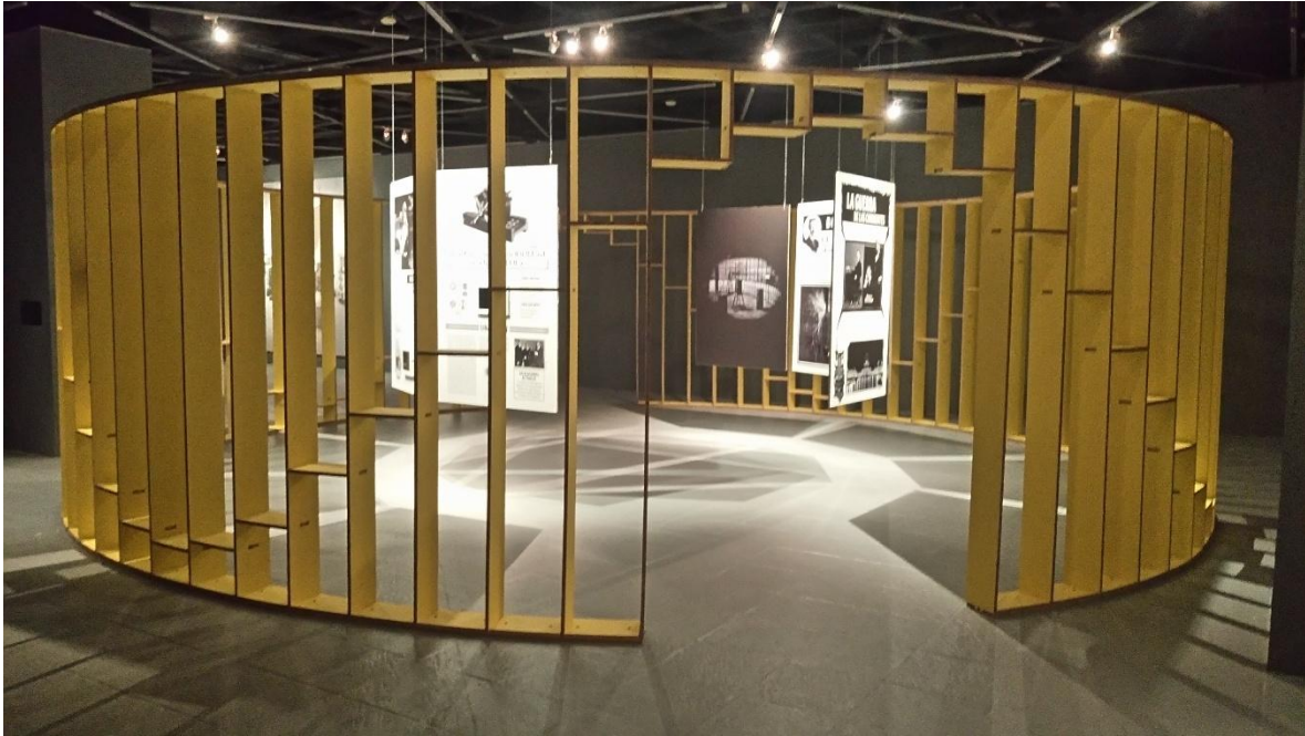
5 Laboratorio de Nikola Tesla en Colorado Springs

laboratorio de Colorado Springs y el experimento con arena. La primera de estas es un círculo generado por el ensamble de módulos rectangulares de re-board. Ayudé en el armado de estos paneles y en su acomodo dentro del espacio.