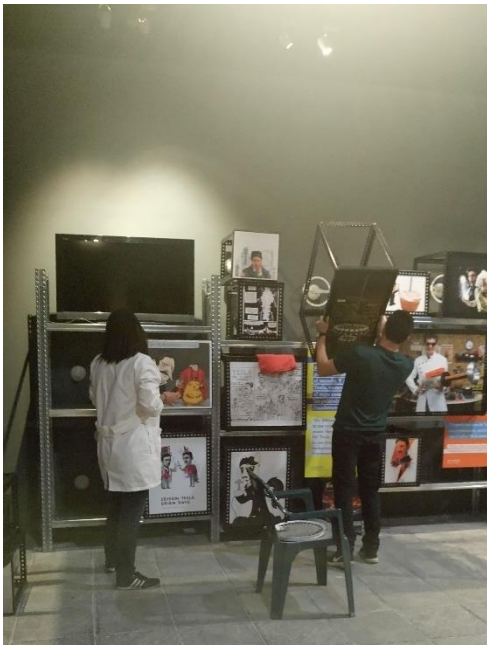
4 Equipo de montaje y yo en la sección Tesla Pop

instaló un juego de imágenes con luz, representado la corriente Tesla pop que muestra la influencia del inventor en la cultura de hoy día. En esta instalación, ayude en el acomodo de las cajas de luz,