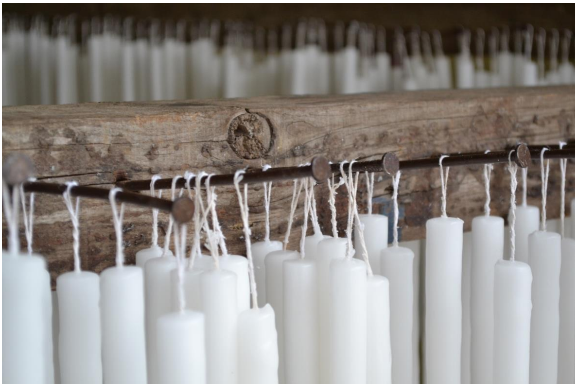
Productores de veladoras