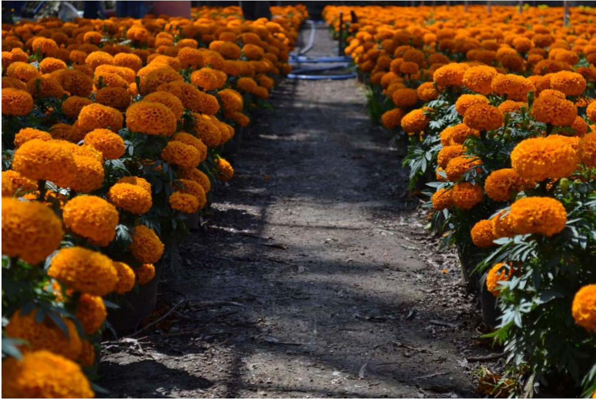
Productores de cempasúchil