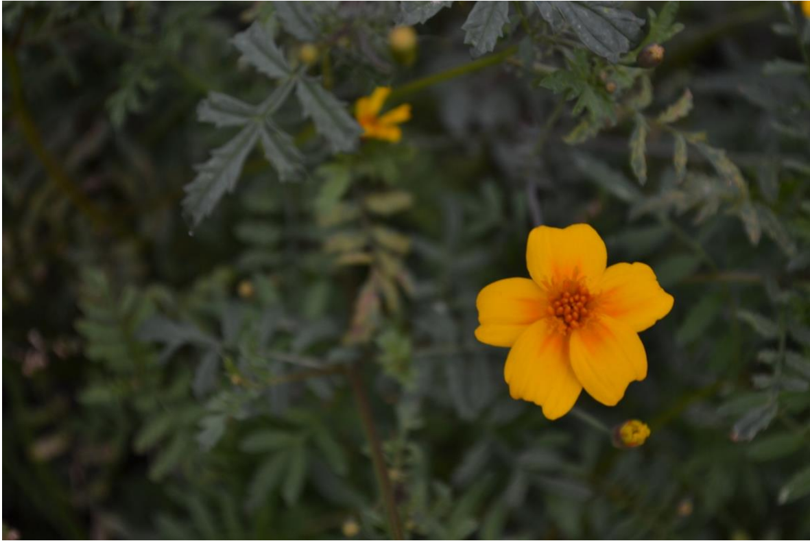
Productores de clemolito