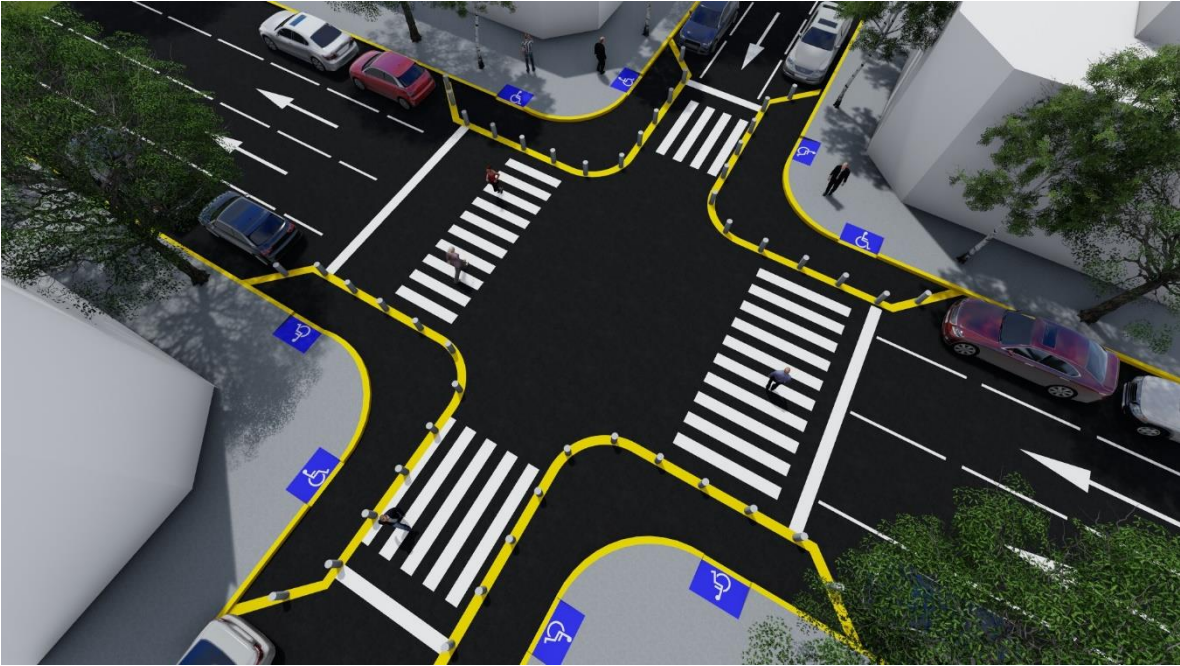
Render: cruce peatón seguro.