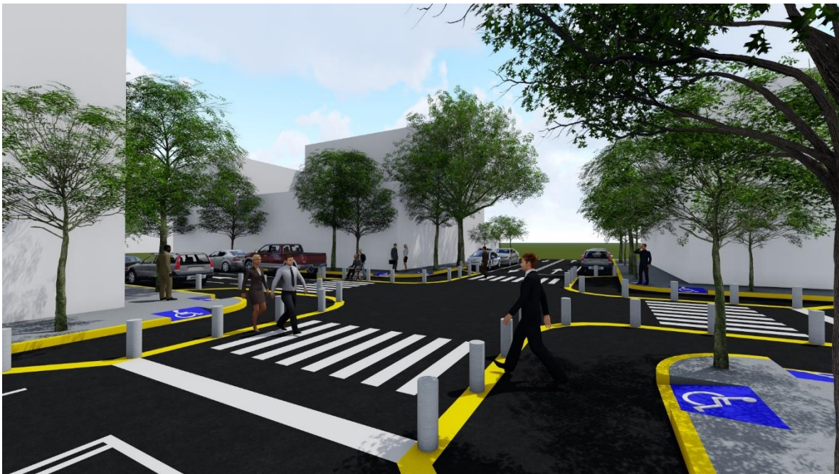
Render: cruce peatón seguro.