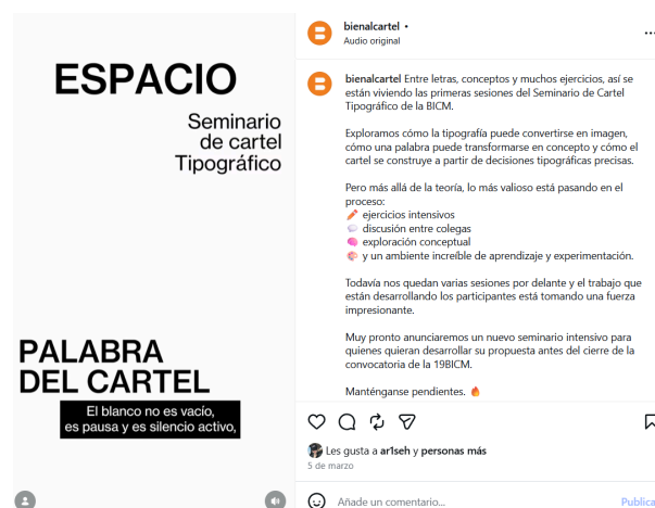
Fig. 6 Captura de pantalla Reel Seminario de Cartel Tipográfico

Este trabajo no solo sirvió como apoyo didáctico para los aspirantes, sino que también ayudó a documentar el proceso educativo que la Bienal ofrece, resaltando la importancia del seminario como una herramienta de formación para los diseñadores.