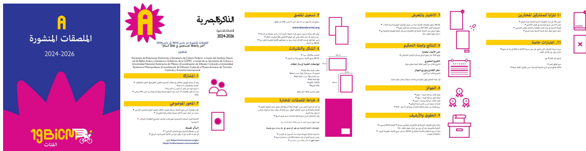
Fig. 1 Categoría A Carteles Publicados 2024-2026 en Arabe

Para la revisión y validación de las traducciones, nos apoyamos en herramientas digitales como Google Translate , utilizando funciones como el escaneo de cámara para verificar que los archivos finales mantuvieran el sentido original de la convocatoria. Fue una experiencia que me enseñó que el diseño no solo debe verse bien, sino que debe ser técnicamente funcional para un público global.