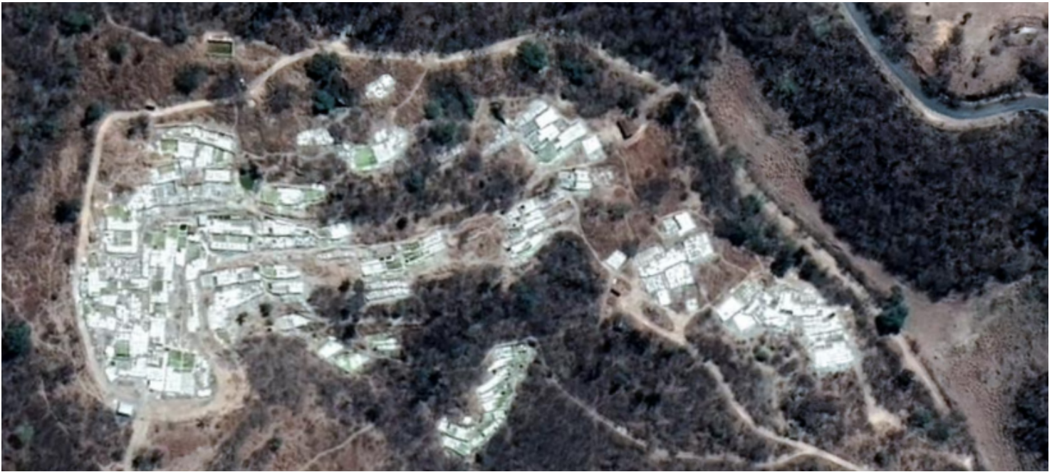
Vista aérea del área de Salineras en la comunidad de Xicotlán, Puebla