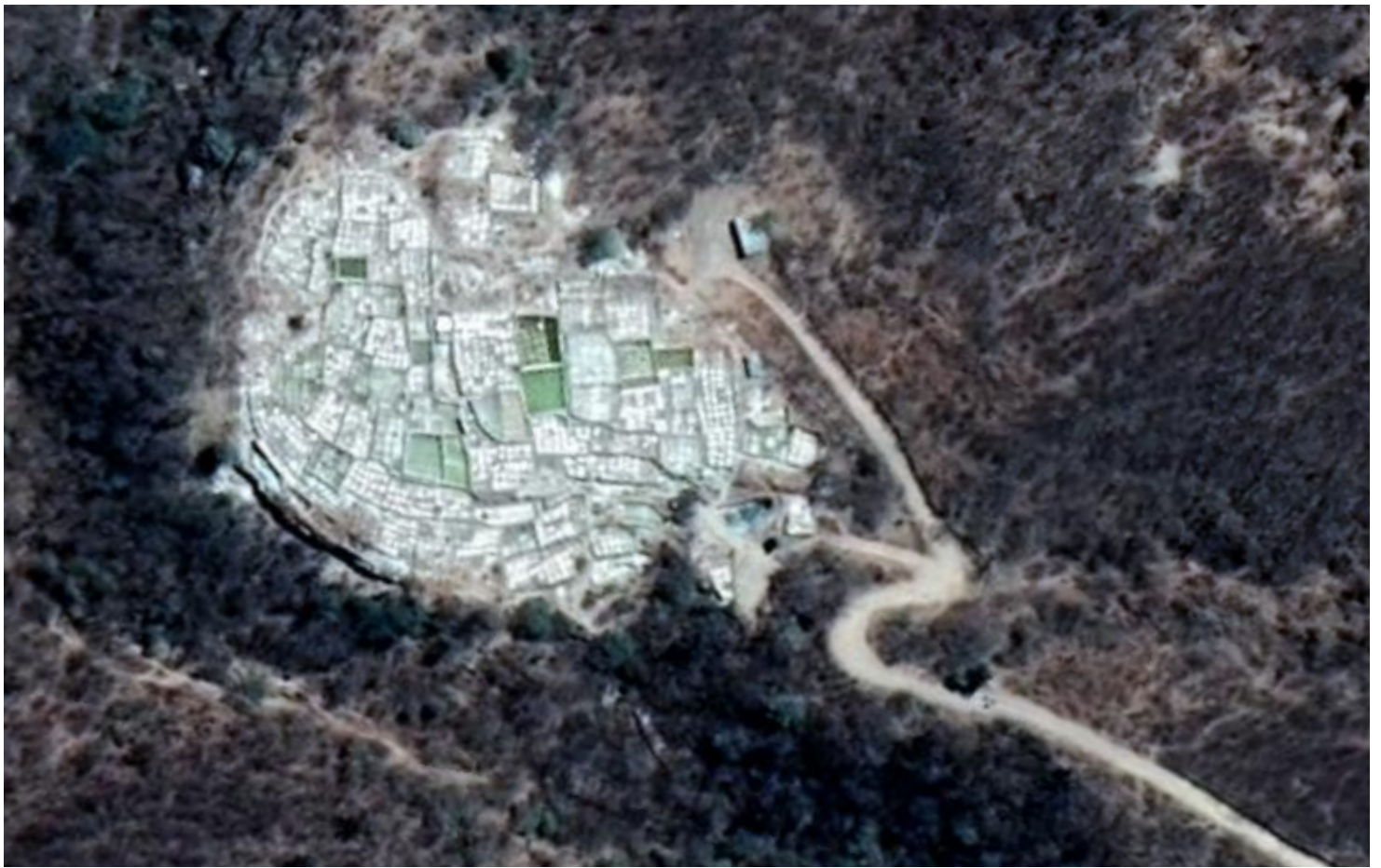
Vista aérea del área de Salineras en la comunidad de Xicotlán, Puebla