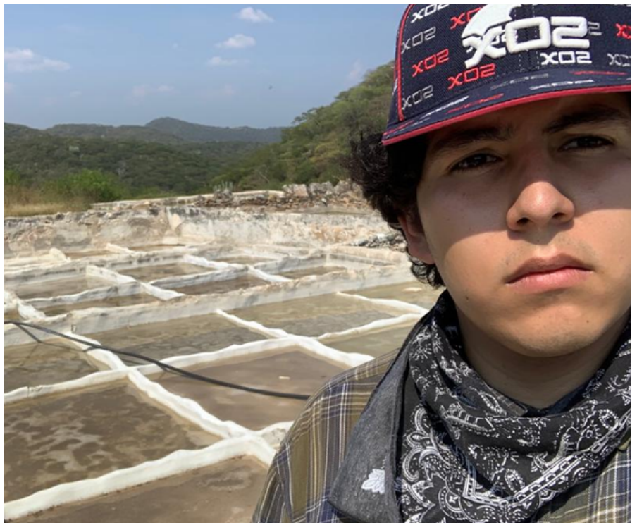
Visita al área de Salineras en la comunidad de Xicotlán, Puebla