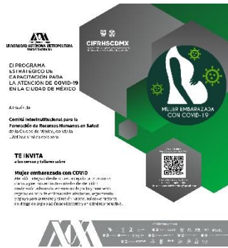
El programa estratégico de capacitación UAMX, Curso, Cartel, 6/10/20, Formato JPG