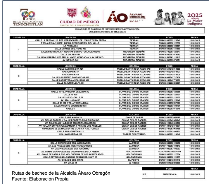
Rutas de bacheo de la Alcaldía Álvaro Obregón