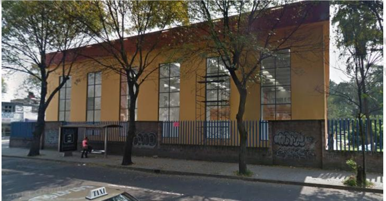
Deportivo Jesús Clark Flores, Av Santa Ana Colonia Avante Ciudad de México, D.F.