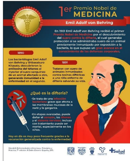
2. Infografía "Primer Premio Nobel de Medicina" (+Salud)