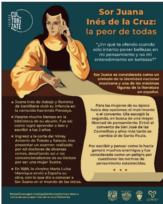
3. Infografía "Sor Juana Inés de la Cruz" (Culturízate FacMed)