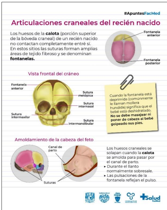
1. Infografía "Articulaciones craneales del recién nacido (Apuntes FacMed)"