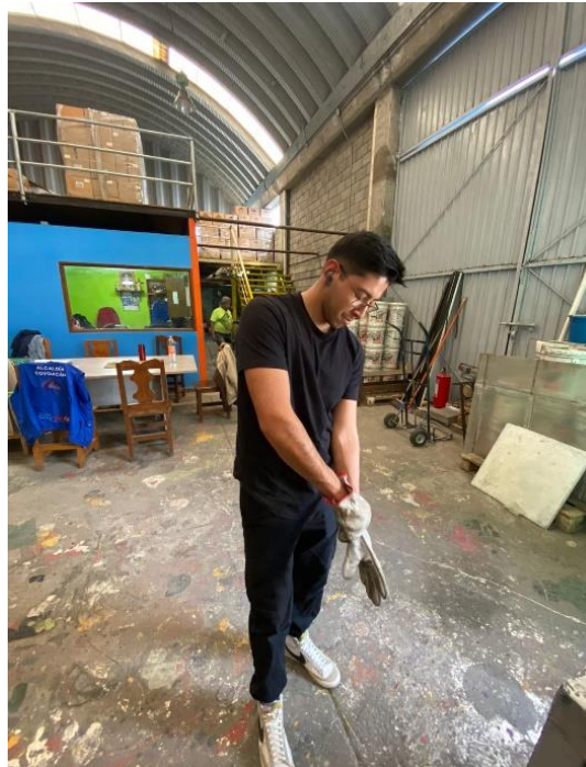
Fotografía 6. Acomodo de tubos de PVC y de cobre para conteo. Fuente: Fotografía tomada por Josue Madrid, noviembre 2023.

Transporte y apilado de tubos de PVC y cobre para facilitar el conteo y manejo de estos materiales. Esta disposición ordenada permitió un acceso más fácil y una gestión más eficiente del inventario.