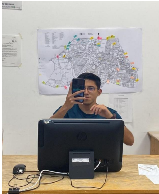
Fotografía 1. Captura de datos de vales de actividades en Obras Públicas

respectivos oficios para la realización de las actividades, así como las hojas de término de los vales.