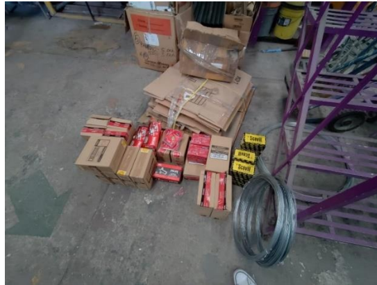
Fotografía 7. Paquetes de material entregados solicitados en almacén.

Organicé y prepare paquetes de materiales específicos para cada trabajador de la Unidad, según las distintas actividades que realizan (carpintería, herrería, albañilería, pintura, electricidad, etc.). Estos paquetes fueron distribuidos a cada trabajador, asegurando que todos tuvieran los recursos necesarios para desempeñar sus tareas de manera eficiente y efectiva.