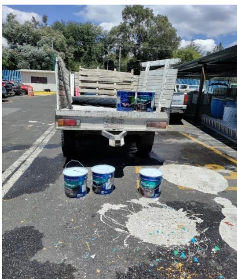
Fotografía 4. Entrega de material para balizamiento. Fuente: Fotografía propia, agosto 2023.

Finalmente, se solicitaba al remitente que firmara dos copias del documento de entrega; una copia quedaba en la Dirección General como registro oficial, mientras que la otra se entregaba al remitente como comprobante de recepción.