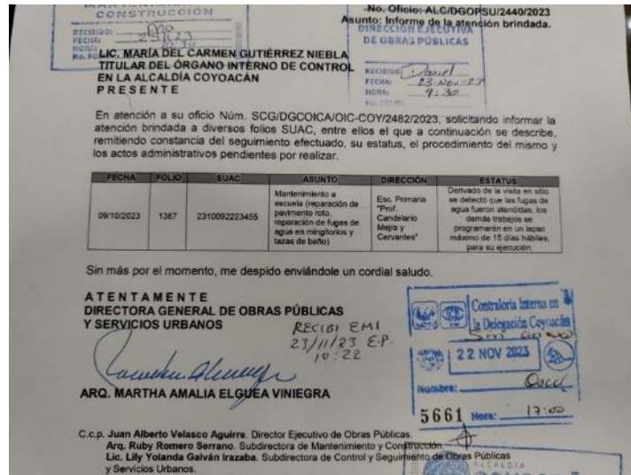
Fotografía 3. Revisión de hoja de trabajo

Lleve a cabo un cálculo detallado de los materiales necesarios para la ejecución de un trabajo específico por parte de la Unidad de Obras Públicas, asegurando que todos los recursos requeridos estuvieran disponibles para el correcto desarrollo del proyecto.