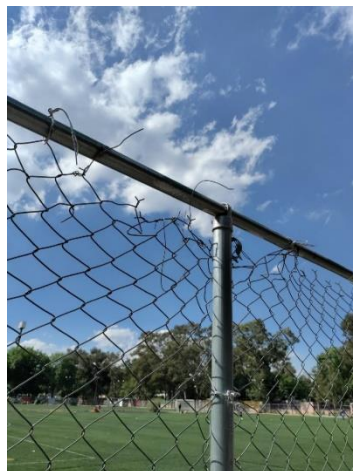
Fotografía 8. Inspección del correcto amarre de la malla ciclónica.

Participé en la una revisión de la instalación de una malla ciclónica en el deportivo "Jesús Clark Flores". El objetivo principal fue asegurar que no hubiera exceso de alambre ni amarres defectuosos, garantizando la seguridad de los niños que frecuentan el deportivo.