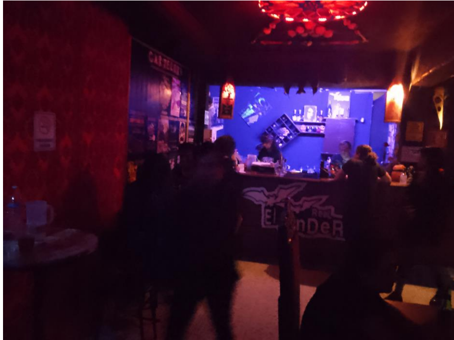
Imagen 22: Barra de alimentos y bebidas en planta baja

Siguiendo sobre esta pared igual a mano a mano derecha se encuentra las escaleras para subir hacia el primer piso, son semi-circulares y toda la pared sobre la que pasan las escaleras está adornada con diversas fotografías e imágenes de personas importantes o representantes de la escena gótica o de la escena underground en general sobre estas e está un candelabro Victoriano con estas coberturas de vidrio para las velas.