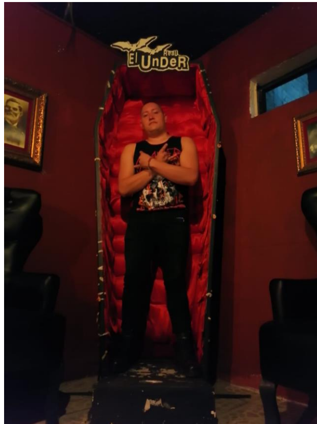
Imagen 27: Foto mía en el icónico ataúd del Real Under

Saliendo de esta área de fumadores tenemos lo que se le conoce como el área de sillones esta área al principio pues este está prácticamente vacía, conforme va avanzando la noche el lugar se va llenando de personas tanto que están cansadas de bailar como personas que están tomando un respiro del caluroso ambiente o incluso aquellas personas que ya han sucumbido ante los efectos de las bebidas alcohólicas, en las paredes hay unos cuadros holográficos, que dependiendo en la posición en la que te ubiques muestran imágenes diferentes, son imágenes con la misma temática del lugar es decir son personas de la época victoriana que vistas desde una perspectiva son personas con su traje o su vestido normal y conforme te vas moviendo se van convirtiendo en calaveras o vampiros con la piel desmembrada y las cuencas de los ojos vacías, en la esquina de esta habitación se encuentra el icónico ataúd forrado con terciopelo el cual sirve para que las personas que asisten se tomen fotos y posen dentro del ataúd del Under.