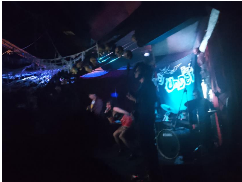
Imagen 30: Sex Vampire tocando en el escenario principal del Real Under

Continuando con el pasillo llegamos al escenario principal el cual está adornado en toda la parte alta con tela que aparenta ser telarañas o como tela vieja rasgada cayendo, en las esquinas también se pueden observar muñecos de esqueletos de medio cuerpo como si este saliera a través de la pared y al centro de la habitación hay un hay dos pilares, en las orillas pegadas al pasillo del que vienes entrando únicamente hay un par de sillones igual para para descansar, toda esta sala se encuentra vacía no hay apenas utilería en medio y es que toda esta esta área de este piso es utilizada como pista de baile, en la esquina a mano izquierda hasta el fondo se encuentra el escenario principal el cual es relativamente pequeño ubicado exactamente en la esquina, en este escenario es donde se suele presentar los días sábados las bandas en vivo así como los Dj de ambiente que animan la fiesta cada fin de semana en este lugar. En el Real Under no permanecí hasta el amanecer ya que alrededor de las 4 de la mañana quedaban pocas personas en el antro, por lo que poco después de la presentación de Sex Vampire la fiesta se terminó.