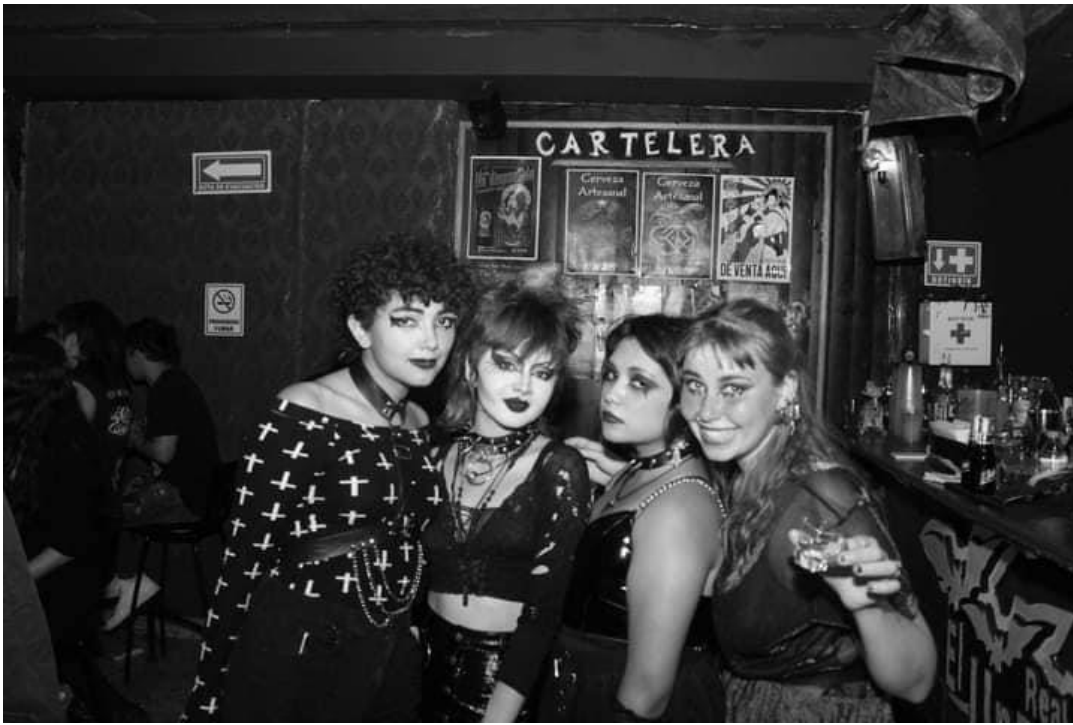
Imagen 33: Amigas en noche de fiesta 18 .

Ahora se abordó un aspecto que resulta muy característico de esta Escena y es el tema del maquillaje, sobre el cual nos comentaron lo siguiente: