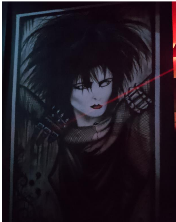
Imagen 2: Dibujo de Siouxsie

Una vez terminas de subir las escaleras, a mano izquierda se encuentra el baño de mujeres, a mano derecha hacia atrás una pequeña habitación a la que se suele denominar como “el área de sillones” o simplemente “los sillones” toda la orilla de esta habitación cuenta con sillas y cojines para descansar, al inicio de la noche este espacio está casi vacío pero conforme las horas pasen y las bebidas alcohólicas se sumen, poco a poco se comenzara a llenar de personas vencidas por el trago, personas cansadas de tanto bailar o incluso aquellos que duermen un par de minutos o incluso un par de horas para continuar la fiesta o esperar el amanecer, frente a esta habitación se encuentra un espacio despejado que se ocupa para bailar, en una de las paredes se encuentra la estructura de una chimenea adornada con cuadros de calaveras y criaturas de la noche, junto a esta chimenea se encuentra otra sección, el escenario, es una habitación que se encuentra dividida con una media pared, el escenario está formado por unas tarimas que se separan apenas un metro del suelo y una valla metálica ligeramente más alta, a los lados unas bocinas grandes sostenidas por una estructura de metal la cual está protegida con cinta en las esquinas, en este espacio tocan las bandas invitadas y es donde se suelen realizar los eventos principales.