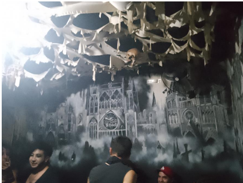
Imagen26: Grafiti de catedrales