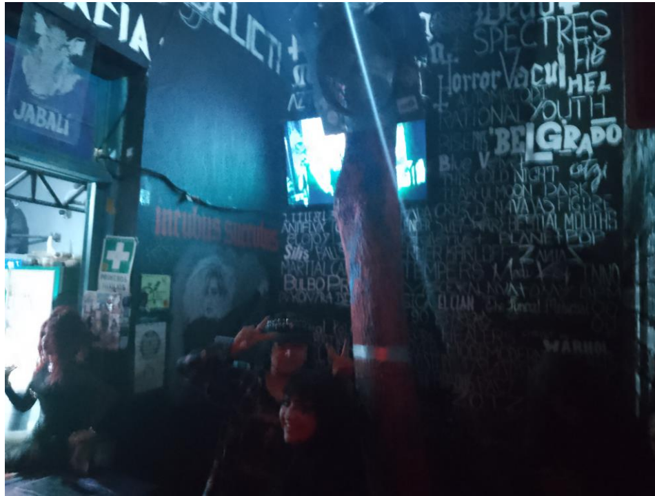
Imagen 6: Barra de bebidas principal

Entre el escenario y la barra se encuentra un pasillo que conecta hacia dos lugares más del primer piso, los baños de hombres, los cuales son un pequeño baño de apartamento, solo cuenta con un retrete y una tina de baño que se usa a manera de mingitorio, las paredes de este espacio se encuentran tapizadas de stickers muy diversos, frente a los baños se encuentra la entrada a los que llaman “la cocina” pues es realmente una cocina, aunque esta no se usa para preparar alimentos, es la entrada al escenario para las bandas y el acceso a esta es exclusivo del personal del lugar y de las bandas o DJ’s que se presentan en el lugar, se podría decir que cumple la función de camerino, al final de estas habitaciones se encuentran unas escaleras de herrería para descender a lo que se denomina “el sótano” sin embargo es en realidad la planta baja del edificio.