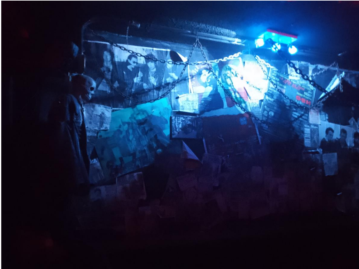
Imagen 21: Calavera con chamarra de piel y muro de fotos

donde toca el dj y estas mesas se encuentran a mitad de la sala está una pista de baile pequeña pues es estrecho el espacio entre las mesas y el dj sin embargo toda esta zona está fuertemente decorada con luces Neón y láseres así como el ya mencionado humo artificial lo cual hace un espacio idóneo para aquellas personas que gustan de bailar durante toda la noche.