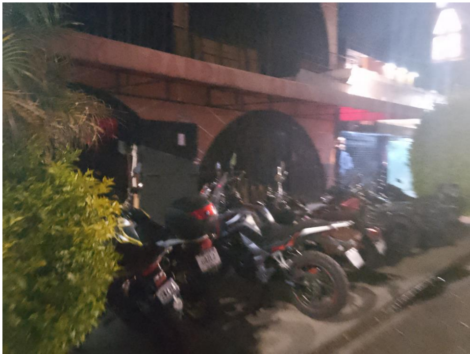
Imagen 18: Motocicletas estacionadas frente al Real Under

El establecimiento se encuentra ubicado sobre la calle de División del Norte muy cerca de la esquina con avenida Taxqueña el lugar se encuentra junto a una panadería de la franquicia Lecaros y un pequeño establecimiento de venta de helados y yogur orgánico la fachada no aparenta ser un lugar de antro un lugar underground Pues en la fachada solo se pueden apreciar unas ventanas grandes unos ventanales grandes semicirculares Así mismo la lona que está sobre esta parte muestra aún los logos de que en algún momento este establecimiento fue un gimnasio, pues recordemos que poco antes del inicio de la pandemia en el 2019 el real Under anuncia el cambio de establecimiento, este antes se localizaba sobre la calle de Monterrey en la Colonia Roma Norte y ahora esta nueva ubicación en Coyoacán es lo que se le conoce como la nueva casa, según nos aproximamos podemos encontrar varias motocicletas estacionadas frente así como un par de personas esperando a entrar en este establecimiento no hay alguien explícitamente diciendo que despejes el área o que si aún no vas a entrar te repliegues hacia las orillas es directamente puedes estar a un lado de la puerta sin entrar, aunque por lo regular las personas que acuden a este lugar y aún no están listas para ingresar esperan en un Oxxo que se encuentra en la contra esquina del establecimiento.