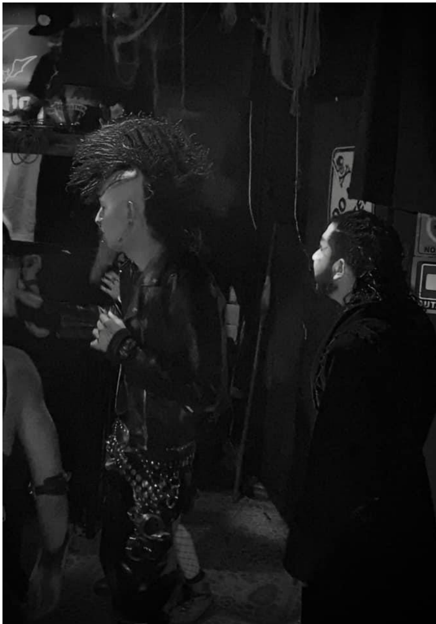
Imagen 36: Encrestado en el Real Under 21 .