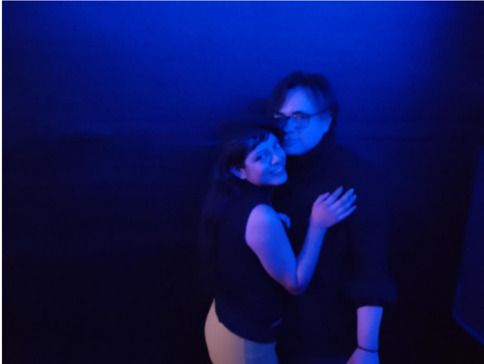
Imagen 16: Par de enamorados en el CDS