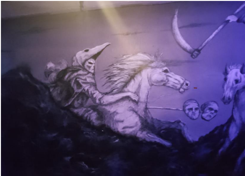
Imagen 13: Grafitis frente a la barra de la planta baja

Saliendo de este cuarto de baile, continua el pasillo hasta un espacio abierto donde se puede estar parado disfrutando de tu bebida, una buena charla o ambas, este es el lugar con mejor ventilación del antro por lo que es idóneo para tomar aire cuando hace falta, frente a este pequeño espacio abierto se encuentra la segunda barra, esta se abre más tarde, cerca de la 1 de la madrugada y solo vende cerveza, el chico que la atiende tiene un estilo Punk, el cabello tiene unas pequeñas púas cortas y al despachar la caguama realiza movimiento bastante llamativos con una especie de navaja de mariposa que en la punta tiene un destapador, así que comprar tu chela en esta barra se convierte en todo un espectáculo.