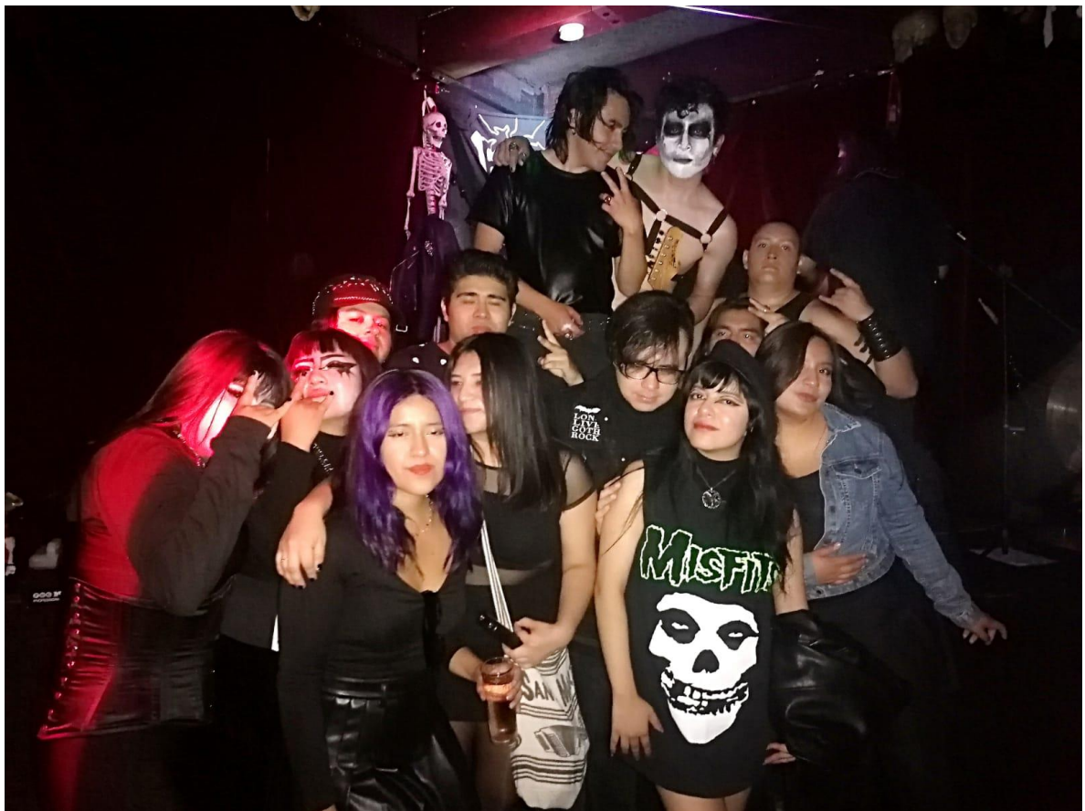
Imagen 32: Guitarrista de los "Misfits Munster" con el público después de su presentación