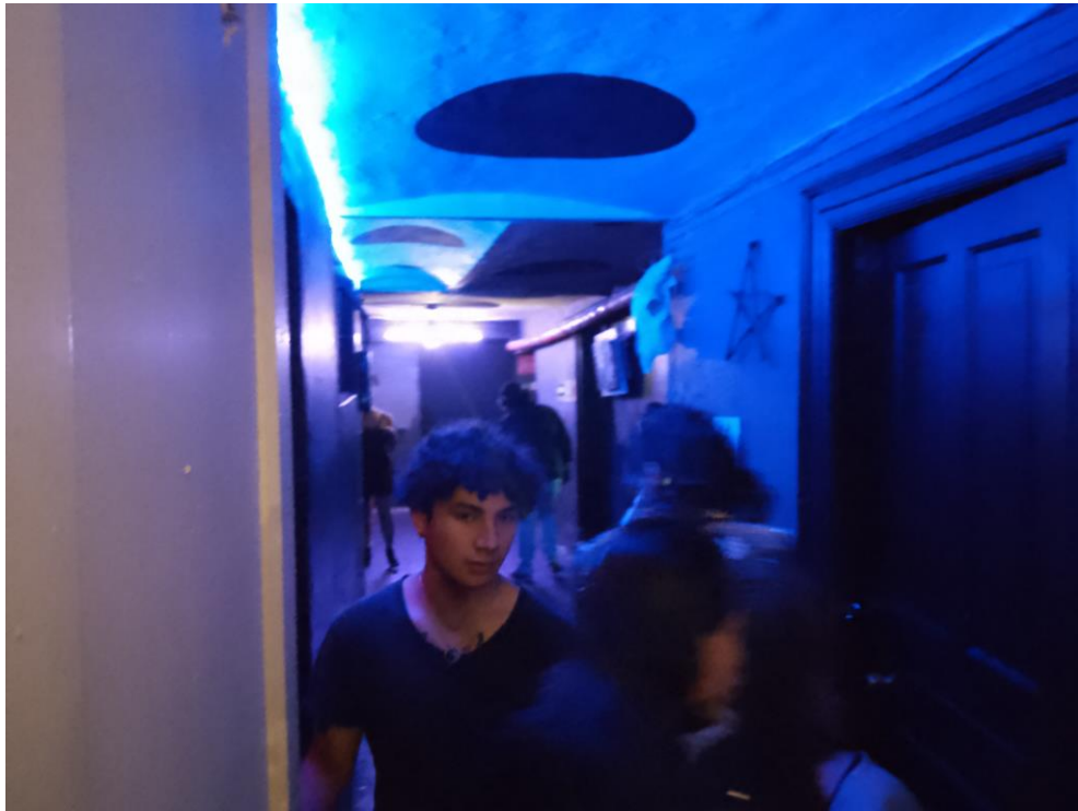
Imagen 15: Pasillo entre el "Sótano" y la barra

La fiesta dura toda la noche, con forme se hacía tarde el lugar se llenaba cada vez más, alcanzando su pico de asistentes alrededor de la 1 de la madrugada, cerca de las 3 o 4 de la madrugada las personas comenzaban a abandonar el lugar, sin embargo, este no quedo vacío ni de lejos, aún quedaban bastantes personas bailando y disfrutando de la noche, a estas alturas las salas provistas con sillones y sillas ya se encontraban completamente ocupadas por personas cansadas, dormidas o noqueadas por el alcohol, alrededor de las 6 de la mañana el personal desaloja toda el área del sótano y debes subir al escenario principal si deseas seguir bailando, la venta de alcohol se suspende y si aún tienes bebida en la botella te proporcionan vasos de plástico desechables para que vacíes tu trago en ellos y te retirar el vaso de vidrio o la caguama, son 6:30 de la mañana y en la pista de baile las personas no paran, son pocos los que son derrotados por el sueño a orillas de la pista, la música se detiene a las 7 de la mañana del domingo, el transporte público ya está dando servicio y la fiesta por fin ha terminado.