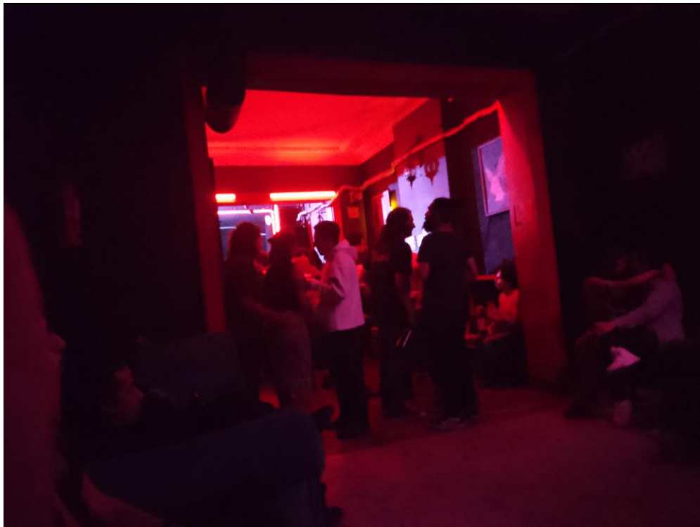
Imagen 17: Área de sillones, ultima foto de la noche