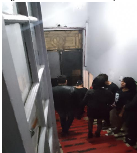
Imagen 1: Entrada al CDS vista desde arriba, todas las fotografías presentadas en este apartado del trabajo son de autoría propia.

En la entrada se encuentran personas encargadas de la seguridad del lugar, si ya pretendes ingresar al lugar puedes hacerlo desde las 7 pm, para ello te piden que hagas una fila junto a la puerta, de lo contrario te solicitan que despejes el área y te dirijas a los extremos de la calle hasta que te sientas listo para entrar o hasta que todos tus amigos se reúnan fuera, una vez te has formado y el personal encargado de la seguridad te revisa pasas la puerta, a mano izquierda, según entras, se encuentra la paquetería la cual tiene un costo de $5, de frente a la puerta se encuentran una escaleras y a la mitad de estas se encuentra una chica cobrando el cover, ese día se pagó $30, cuando pagas te colocan un sello en el antebrazo con lo cual puedes entrar y salir del lugar a gusto, con ello terminan los protocolos para ingresar al lugar.