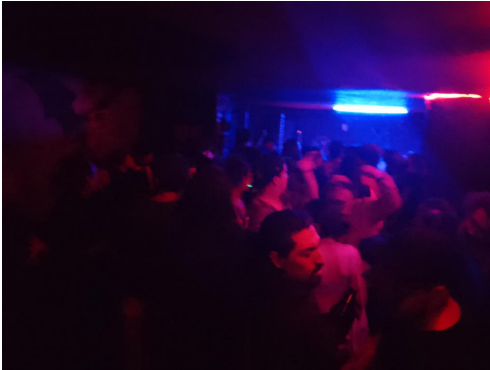
Imagen 11: "Sótano" pista de baile

bailar por lo general es poco, aquí lo que suena es en su mayoría tecno y electrónica con ese toque siniestro, la poca iluminación hace que los accesorios y artículos brillantes color neón luzcan con mayor intensidad.