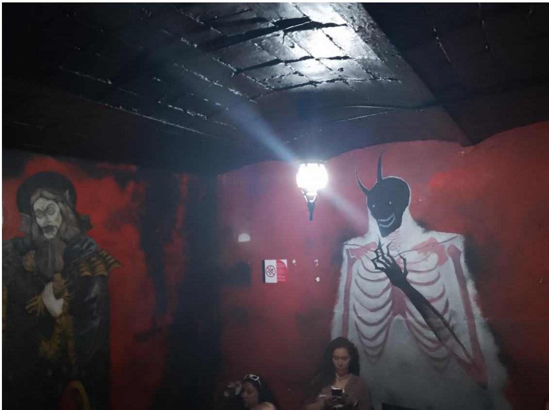
Imagen 9: Imagen de Drácula en área de descanso