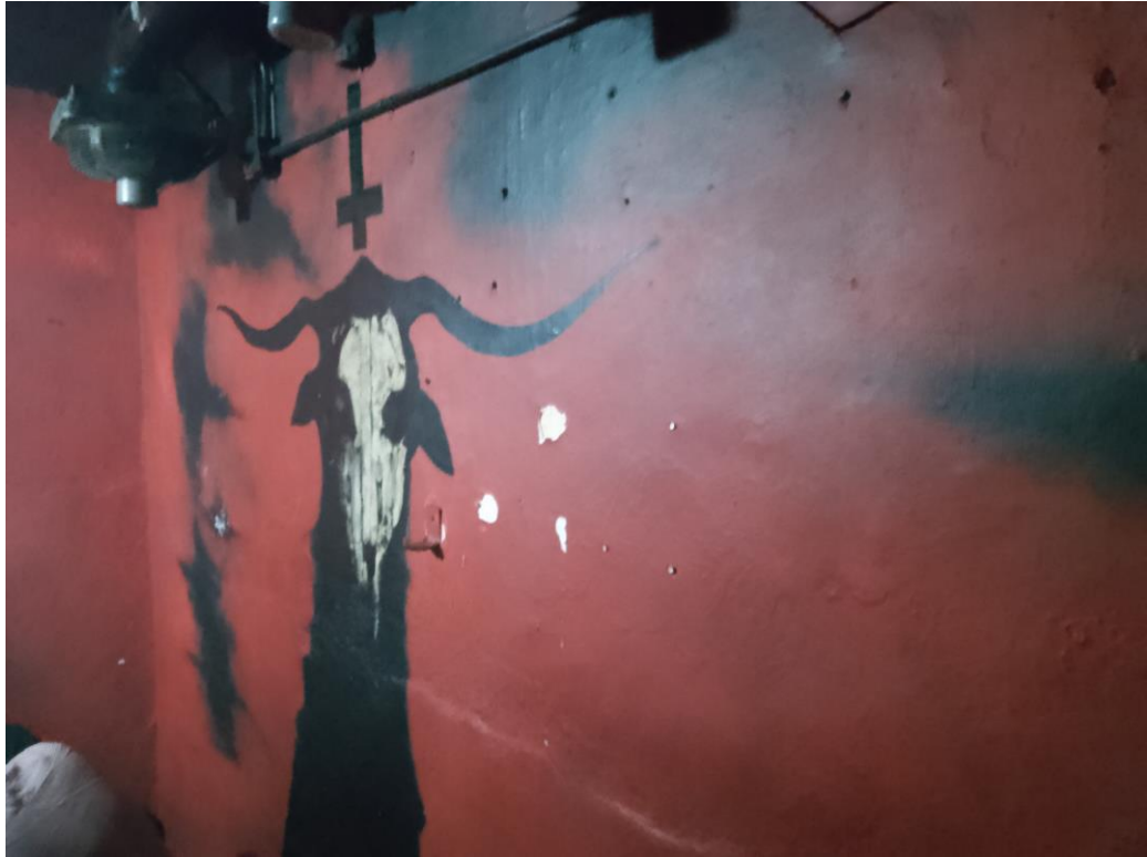
Imagen 8: Grafitis del área de "fumar"