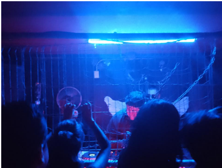
Imagen 12: Área de DJs en el "Sótano"