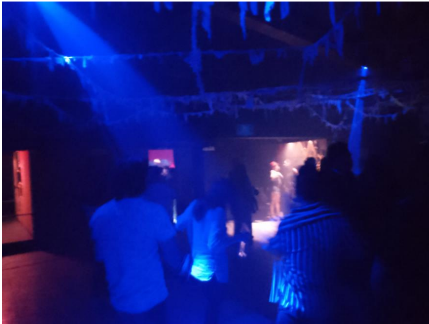
Imagen 31: Pista de baile del primer piso