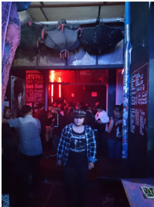
Imagen 5: Vocalista del Grupo EESCA caminado hacia la barra

A mano izquierda del escenario se encuentra la primera barra de bebidas, en primer lugar, se encuentra una mesa con varios platos pequeños de plástico y botellas con salsa para botanas, al centro de la mesa un recipiente grande lleno de chicharrones, este recipiente se mantendrá siempre lleno a lo largo de la noche, sobre la mesa de botanas se encuentra pintado el menú de bebidas, el cual es variado, desde cremas de mezcal, pulque, tragos preparados, mojitos, perlas negras y como no, la bebida más vendida del lugar, la cerveza en presentación de “caguamon”, junto al menú la propia barra atendida por una dama que luce vestidos victorianos adornados con encaje negro y un llamativo corset, al centro de este espacio hay un tronco de árbol que sobre sale del suelo y en el cual está colocado una especie de ventilador, en las paredes de este espacio están pintados los nombres de todas las bandas que se han presentado al menos una vez en este antro.