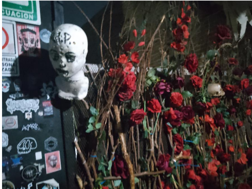
Imagen 25: Muro de flores Área para fumar

pared de nueva cuenta el logo del establecimiento Real Under, nada más entrando a esta sala de mano izquierda se encuentra una especie de biombo con ramas de madera y flores artificiales para simular que la habitación se encuentra completamente cerrada sin embargo este espacio da completamente a la intemperie es digamos el balcón, cubierto por este por este biombo de ramas y flores artificiales.