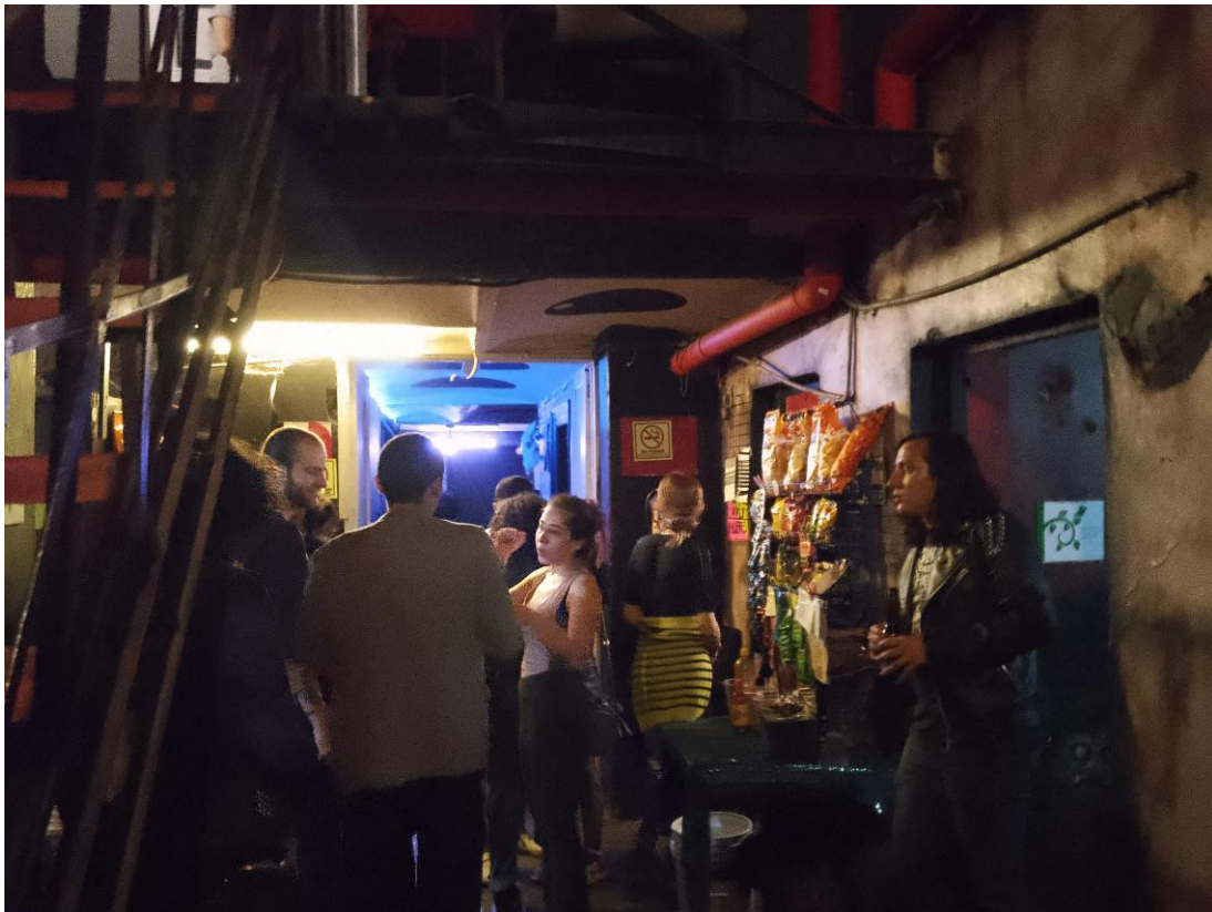
Imagen 10: Planta baja dulcería

Saliendo de estas habitaciones “para fumar” se encuentran los baños de este piso, de lado derecho el de mujeres, el cual tiene un pequeño puesto de dulces a lado, en realidad en la entrada de todos los baños hay ubicado un pequeño puesto de dulces y cigarros, sin embargo, este salta más a la vista, de frente al baño de mujeres se encuentra el baño de hombres, en esta ocasión si hay un mingitorio instalado, pero resalta a la vista los lavaderos de piedra que están frente a estos, con esta escena queda claro que el edificio en algún momento fue una casa o una vecindad que fue adaptada para ser antro, sin embargo los cambios se limitaron a quitar algunas puertas y ventanas, dejando ese detalle de lado, restan solo tres espacios más.