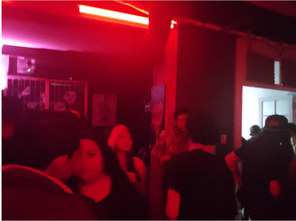
Imagen 3: interior del CDS