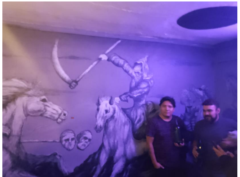
Imagen 14: Personas platicando en CDS