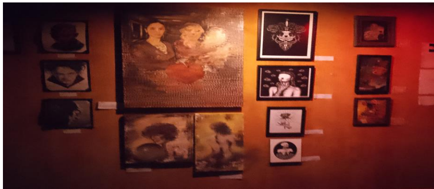
Imagen 29: Galería de arte del Real Under

Siguiendo a mano izquierda tenemos un pequeño pasillo apenas adornado con un par de cortinas, durante las noches de antro este pasillo tiene poco uso más que para aquellas personas que ya están cansadas y no alcanzaron lugar en el área de sillones pues se sientan en este pequeño pasillo, ya que en días normales o días en los que se realizan bazares o muestras artísticas este espacio suele ser donde se colocan fotografías, obras de arte o puestos de estos bazares, pero durante la noche de antro este pasillo no suele contener nada que resalte.