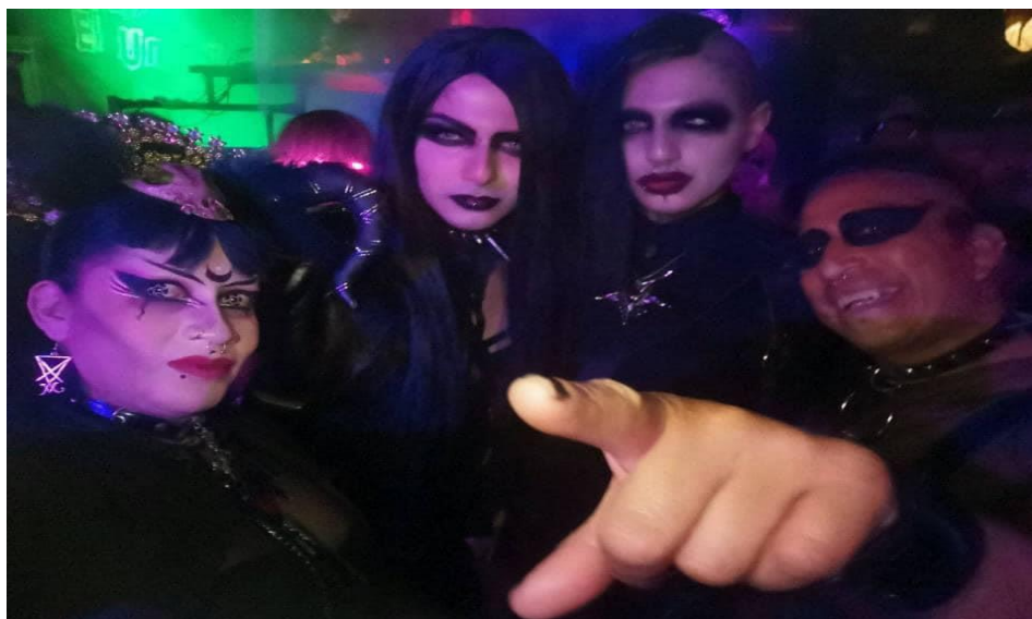
Imagen 34: El maquillaje en la Escena 19 .

“Bueno, yo no creo que sea una cuestión de gustos y preferencias, yo creo que la cuestión es perturbar o transgredir, ¿no? Este, más en, pues, en un mundo, digamos, donde, pues, la mujer se maquilla y el hombre no se maquilla, y más a lo mejor en una sociedad, pues, como la mexicana, pues, machista, pues, que un hombre se maquille, pues, busca, digamos, transgredir este cierto status quo” (Marcelo, 28 años)