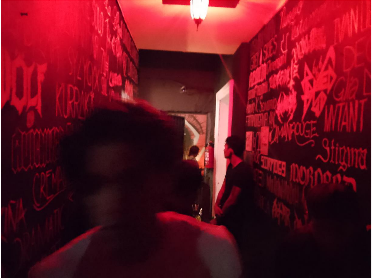
Imagen 7: Pasillo con nombres de bandas que se han presentado en CDS

Una vez bajas las escaleras tienes dos habitaciones, una de cada lado, estos cuartos se usaban como área de fumadores, debido a las reformas en la capital este espacio ahora se usa como área de descanso, similar al área de sillones descrita anteriormente, en las paredes de estas habitaciones se encuentran grafitis de demonios, desde un conde vampírico que sostiene en sus manos a unas personas desnudas, una especie de demonio mostrando su esqueleto, sillones rotos y deteriorados están colocados a las orillas, así mismo hay en la habitación del lado izquierdo según bajas hay una pequeña mesa, estos espacios se usan comúnmente para tomar un respiro del baile y la fiesta, es un espacio idóneo para platicar con conocidos y también para charlar con desconocidos.