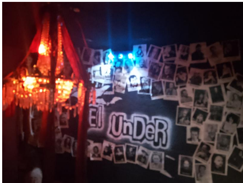
Imagen 23: Candelabro y fotos de representantes de la Escena

Siguiendo sobre esta pared igual a mano a mano derecha se encuentra las escaleras para subir hacia el primer piso, son semi-circulares y toda la pared sobre la que pasan las escaleras está adornada con diversas fotografías e imágenes de personas importantes o representantes de la escena gótica o de la escena underground en general sobre estas e está un candelabro Victoriano con estas coberturas de vidrio para las velas.