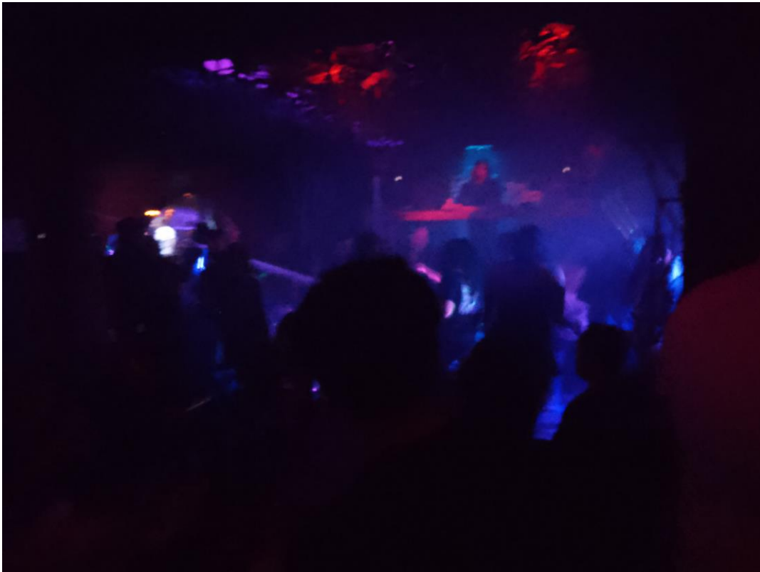
Imagen 20: DJ de planta baja

Una vez que se cruzan estas estas cortinas el ambiente cambia radicalmente de entrada el espacio es mucho más oscuro que el exterior e iluminado por apenas unos cuantos láseres que predominan en colores morados y verdes rojos también y una especie de humo artificial que sale del escenario de este piso del lado izquierdo tenemos un gran espejo un espejo que cubre casi la totalidad de la pared y debajo del espejo una serie de mesas tipo restaurante de comida rápida ya que este establecimiento el real Under los sábados suele tener servicio de comida y bebida desde las 3 o 4 de la tarde hasta cerca de las 9 de la noche que es cuando empieza ya digamos el ambiente de antro, a partir de las 9 ya dejan de ofrecer el servicio de alimentos, únicamente bebidas, por esta razón algunas de las chicas que forman parte del personal de este establecimiento cuentan con una vestimenta que crea una mezcla entre estética de mesera con la propia estética del lugar es decir una estética más underground,