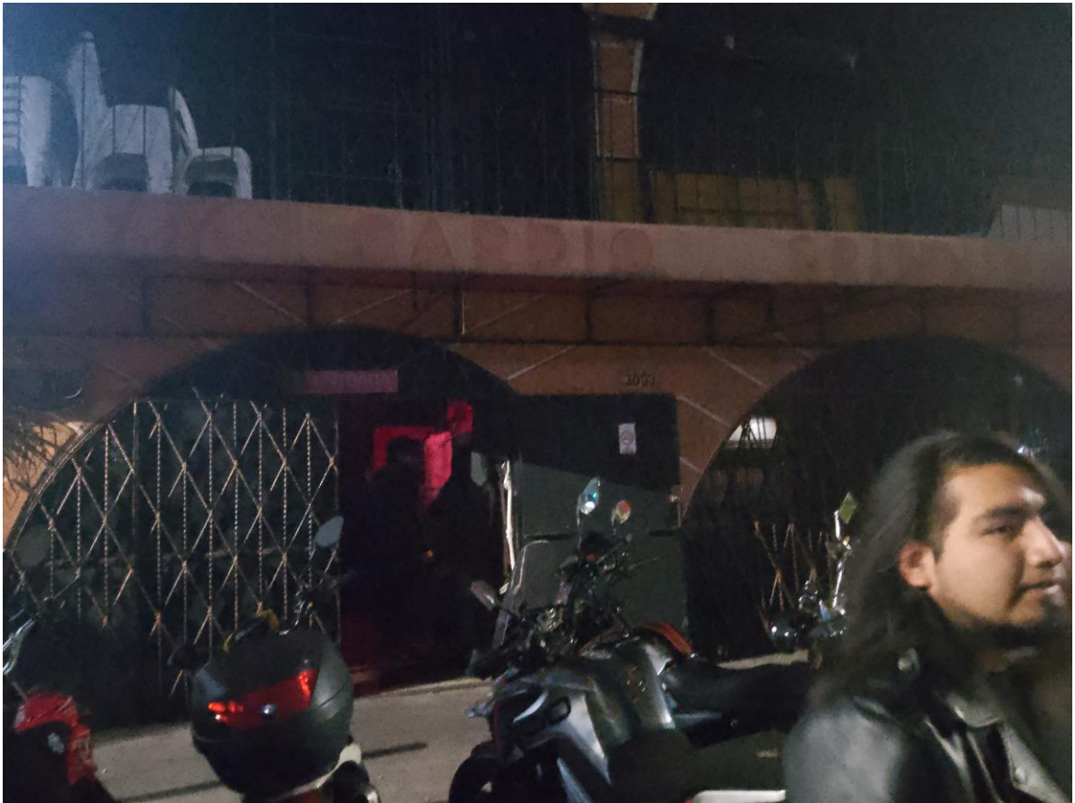
Imagen 19: Puertas de entrada al Real Under

Las puertas del establecimiento se encontraba semi abierta justo en la entrada había una persona indicándote si estabas listo para entrar, justo la recepción es un pequeño espacio inmediato a la puerta en donde se encuentran tres personas encargadas de la seguridad del lugar, una vez pasas a , ellos se encargan de revisarte con el fin de verificar que no intentes ingresar al establecimiento con algún tipo de bebidas alcohólicas o armas, Una vez terminada esta pequeña revisión procedes a mano derecha a donde hay una paquetería, en este mismo lugar se paga el cover que en días sábados o en el día en el que se asistió fue de $50 una vez realizado el pago te colocan de igual forma un sello en el antebrazo, Este espacio relativamente estrecho está adornado con algunas imágenes de carácter demoniaco, algunos esqueletos, hay poca iluminación y el espacio entre esta recepción digamos y la entrada ya propiamente al establecimiento está delimitada por varias cortinas gruesas.