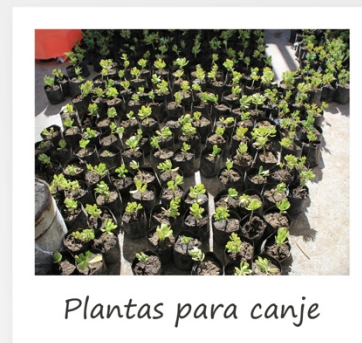
Plantas para canje