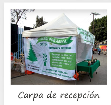
Carpa de recepción