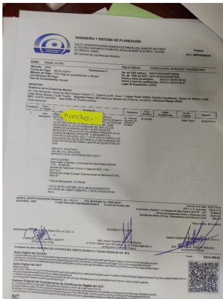
Imagen 4: Factura