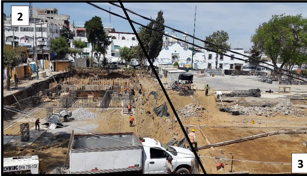
Imagen 2. Construcción del edificio administrativo de la Alcaldía Milpa Alta, febrero 2020. Fotografía de Rogelio Flores, 4 de marzo de 2020.