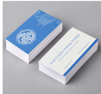
Tarjetas de presentación