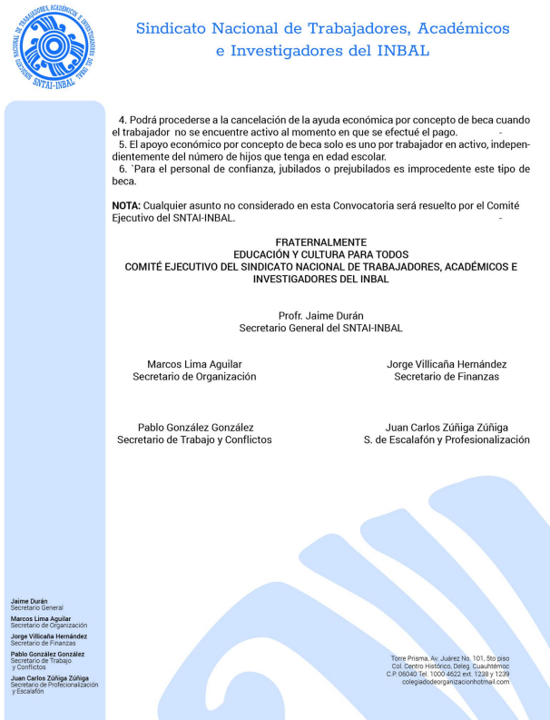
Formato de comunicado