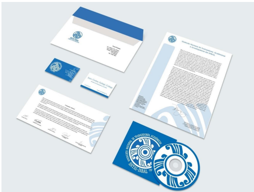
Papelería homologada con el logotipo del SNTAI-INBAL