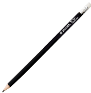
Lápiz con logotipo del SNTAI-INBAL