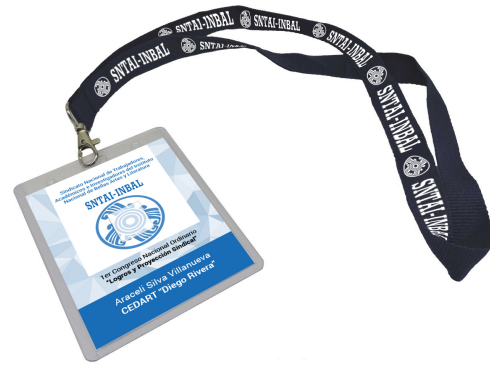
Gafete con correa diseñado para el Congreso Nacional Ordinario