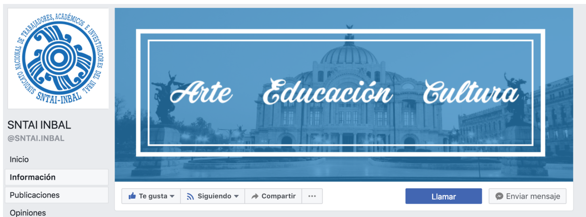
Página de Facebook del SNTAI-INBAL