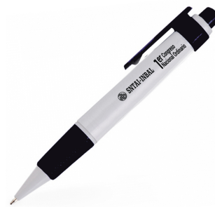
Pluma con logotipo del SNTAI-INBAL