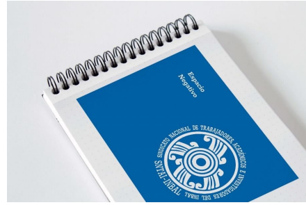
Manual de identidad corporativa