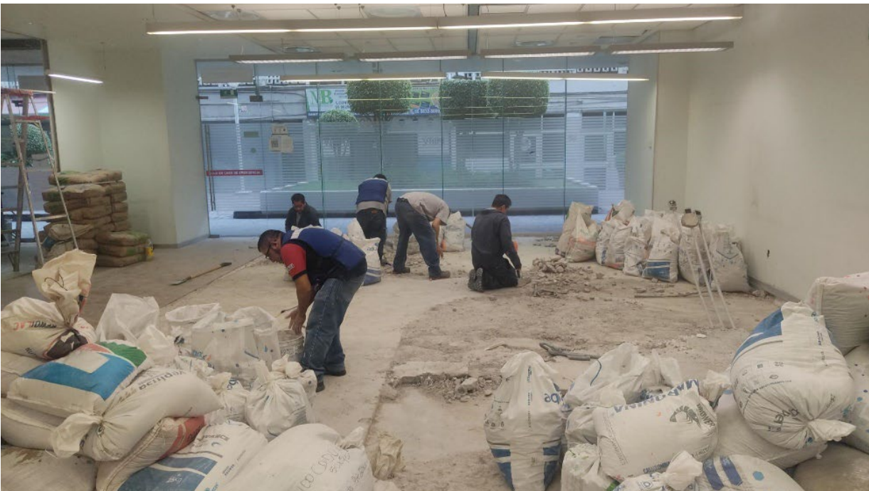
imagen 3: Nivelación de Firme para trazo y levantamiento de muros en el proyecto TNNF.

CNBV - Comisión Nacional Bancaria y de Valores, CDMX.