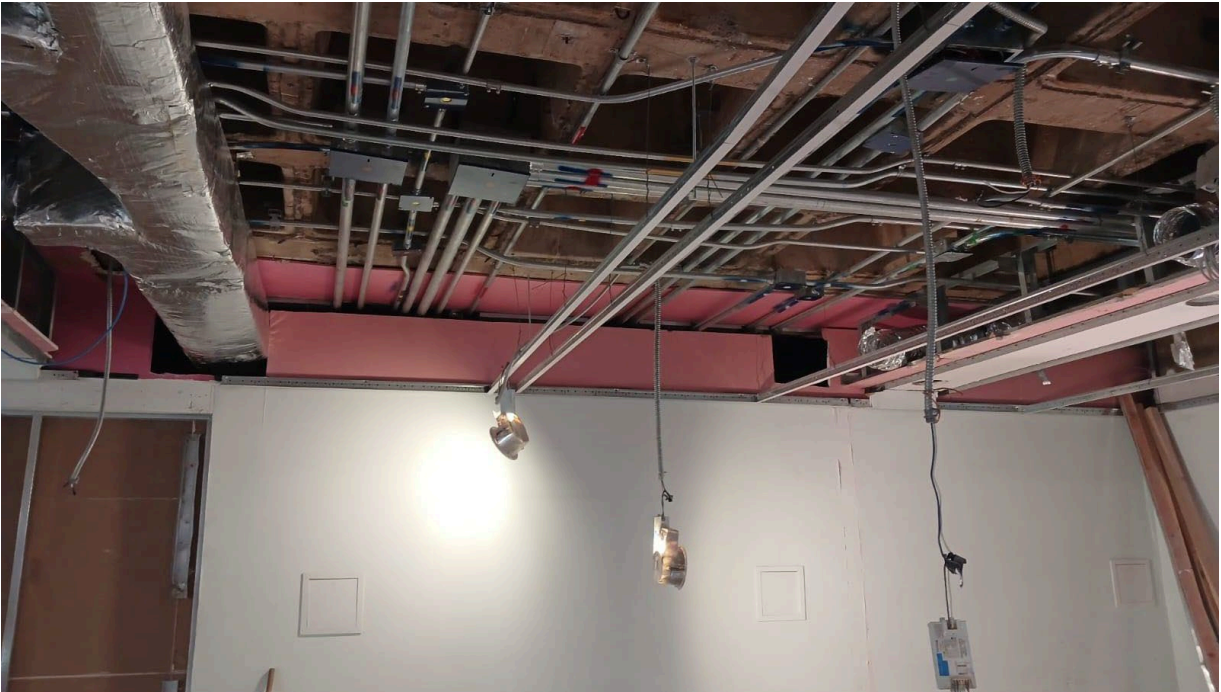
Imagen 2: Identificación de Instalaciones en proyecto TNNF.

CNBV - Comisión Nacional Bancaria y de Valores, CDMX.