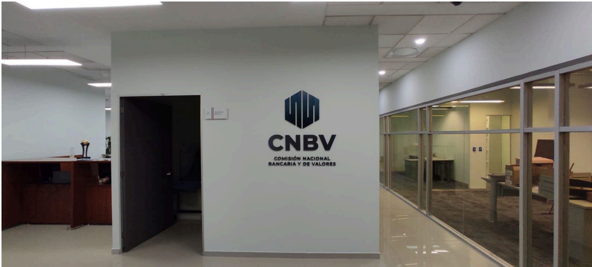
Imagen 7: Termino de detalles y colocación del logo institucional del Proyecto TNNF-Servicio Médico y Sindicato.

CNBV - Comisión Nacional Bancaria y de Valores, CDMX.