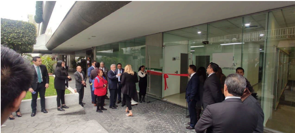
Imagen 8: Inauguración del Proyecto TNNF-Servicio Medico y Sindicato por parte del presidente de la Comisión Nacional Bancaria y de Valores.

CNBV - Comisión Nacional Bancaria y de Valores, CDMX.