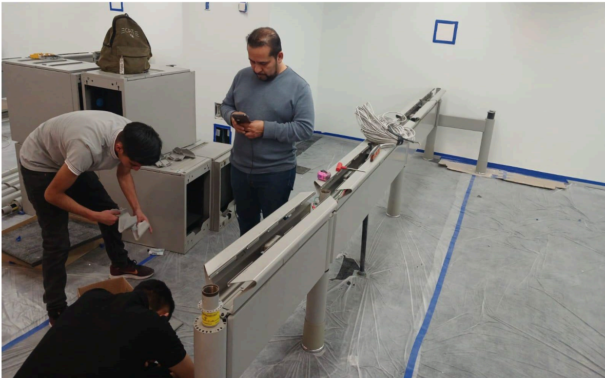
Imagen 6: Armado de Mobiliario tipo para usuarios.

CNBV - Comisión Nacional Bancaria y de Valores, CDMX.