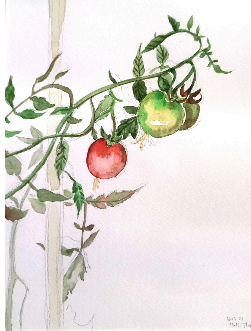
Imagen 2 (después)