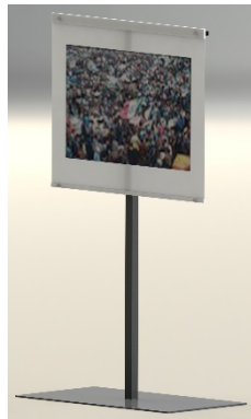
Ilustración 4 Base señal de tránsito