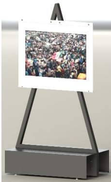
Ilustración 3 Base caballete

La primera propuesta fue inspirada en un caballete, la segunda propuesta en un letrero peatonal y la tercera en un estandarte. En las tres se propone sujeción mediante barras de aluminio y tornillos para dar estructura en la parte superior y peso en la parte inferior con el fin de evitar que se arruguen las fotografías.