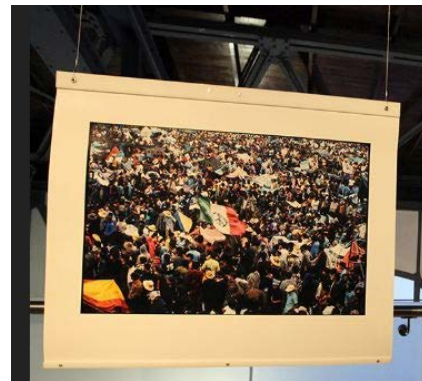
Ilustración 7 Marco colgante Museo Universitario del Chopo