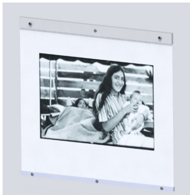
Ilustración 6 Marco colgante Avándaro

En una segunda entrevista con la artista, se le mostraron las propuestas, pero ella solicitó que se desecharan. Con la idea de que su obra se viera más limpia, ella sugirió que se colgaran y se conservaran los sujetadores, pero en color blanco. La propuesta final fue sujetadores de acrílico blanco aprisionados con tornillos/esparrago y tuercas, colgados con cable de acero.