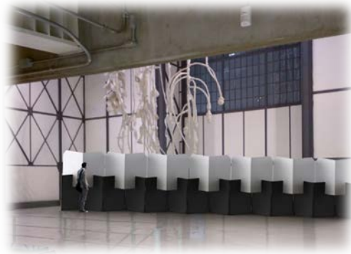
Ilustración 1 Mamparas en galería central Museo Universitario del Chopo

La propuesta para resolver este proyecto fue una mampara plegable con forma de biombo; estructura de tubo cuadrado de aluminio; pantallas superiores de lámina de coroplast en color blanco para colocación de impresos de marketing; pantallas inferiores de pvc espumado en color negro; también cuenta con rodamientos para su transporte; la pantalla superior es desmontable, esta se guarda en la parte inferior; son apilables para su fácil almacenamiento.