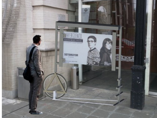
Ilustración 2 Cartelera en patio frontal Museo Universitario del Chopo

La propuesta fue un diseño inspirado en una carreta de flores la cual su estructura principal es de tubo cuadrado de acero inoxidable que la hace resistente a los cambios de clima y pantallas de cristal templado para la colocación de impresión en material electrostático que evita la degradación del mismo, cuenta con una rueda sin centro y agarraderas para transportarla en forma de carretilla dentro y fuera del museo. El sistema de iluminación es con focos de halógeno. Este producto se cotizo con dos proveedores el cual el costo de materialización es de $30,000 y se encuentra en espera de presupuesto.