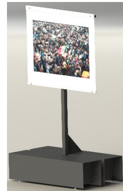
Ilustración 5 Base estandarte

En una segunda entrevista con la artista, se le mostraron las propuestas, pero ella solicitó que se desecharan. Con la idea de que su obra se viera más limpia, ella sugirió que se colgaran y se conservaran los sujetadores, pero en color blanco. La propuesta final fue sujetadores de acrílico blanco aprisionados con tornillos/esparrago y tuercas, colgados con cable de acero.