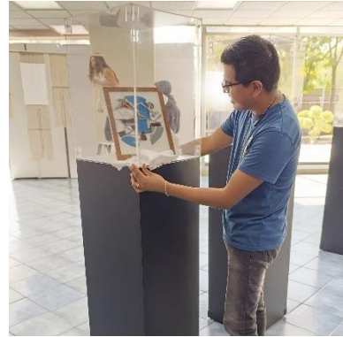
Imagen 12 Desmontaje exposición "Notas Bordadas" de Katarzyna Laskowska