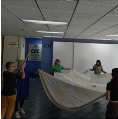
Imagen 10 Exposición "Notas Bordadas" de Katarzyna Laskowska