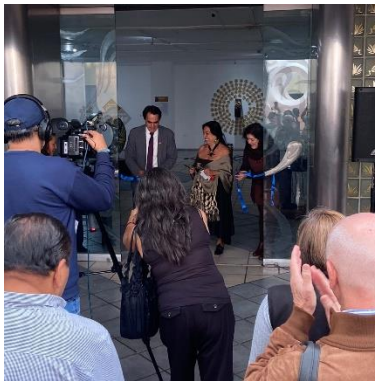
Imagen 8 Exposición "Las sombras también migran" de Betsabé Romero