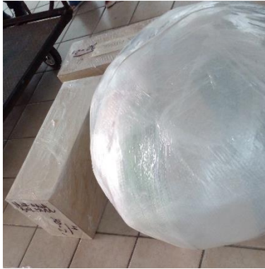
Imagen 2 Exposición "Inspiración Tamayo" artistas colectivos