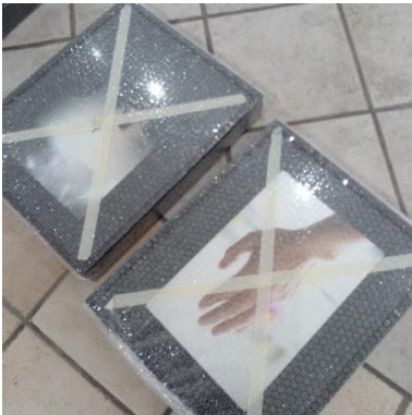
Imagen 4 Exposición "Always Somewhere" de Rebeca Martell