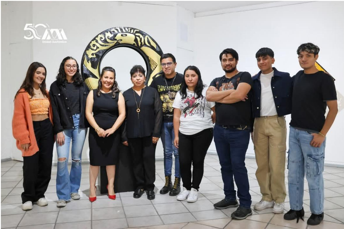
Imagen 13 35 aniversario de la Galería del Sur