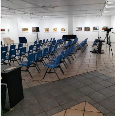
Imagen 1 Exposición "La mirada insurrecta" de Mauricio Gómez Morin