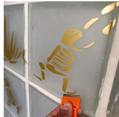
Imagen 9 Desmontaje exposición "Las sombras también migran" de Betsabé Romero