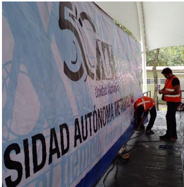
Imagen 5 Preparación conversatorio "Porque nos gusta el rock: Las mujeres en escena"