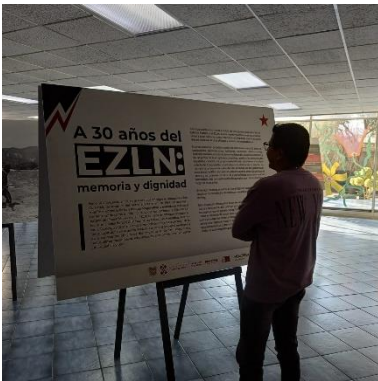
Imagen 7 Exposición "A 30 años del EZLN: memoria y dignidad"