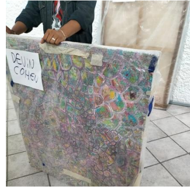
Imagen 3 Exposición "Lienzo a cielo abierto" de Devin Cohen