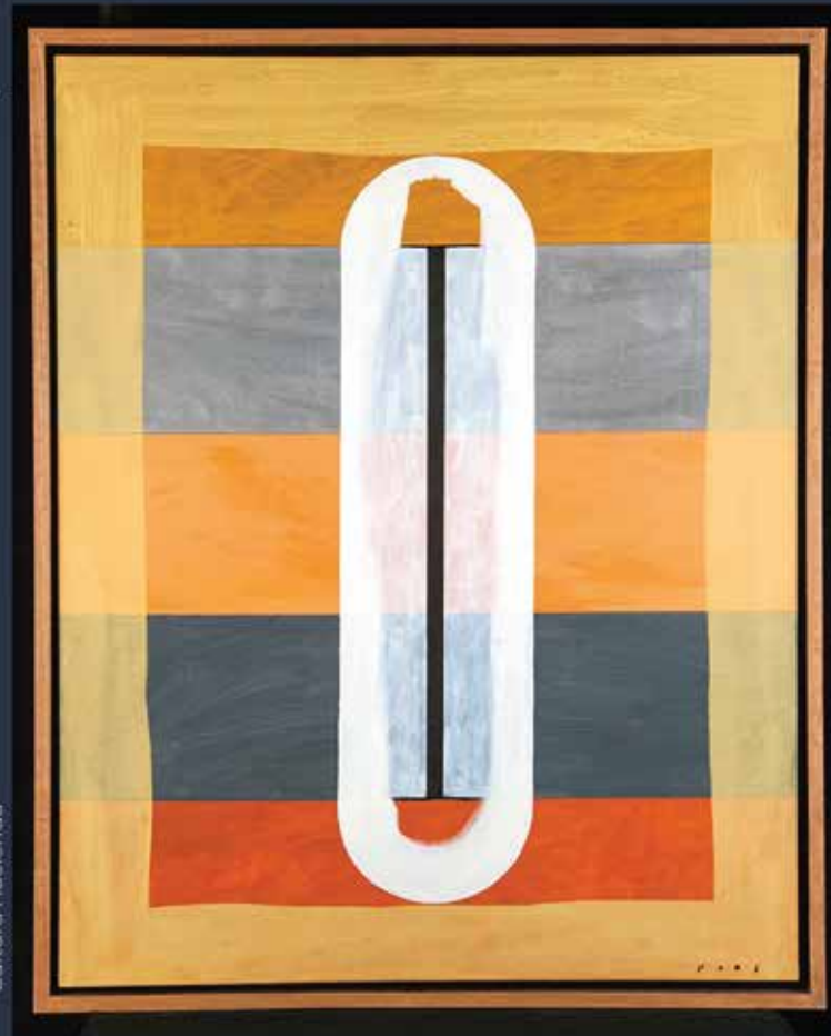
José Fors, La Pildora , 2007, Acrílico sobre tela. Col. Pago en Especie, SHCP