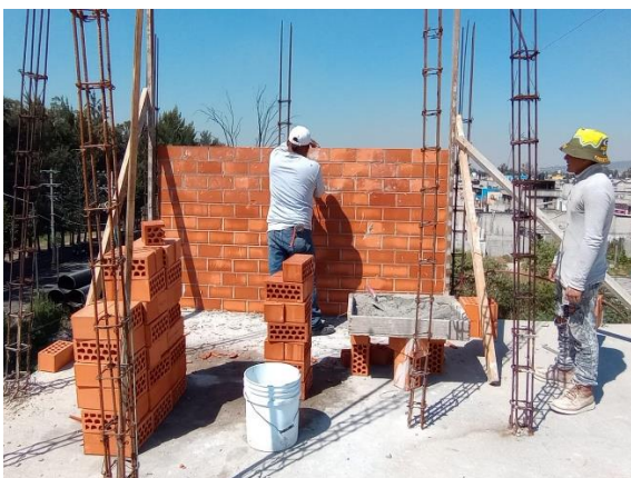
Imagen 5. Colocación de block cerámico para bases de tinacos en Manzana #25 diciembre del 2022