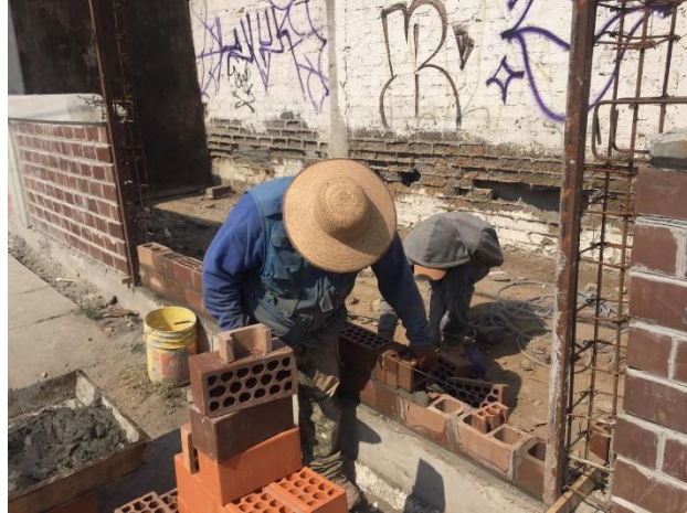
Imagen 6. Colocación de block para murales en Tlaxillacalli enero de 2023