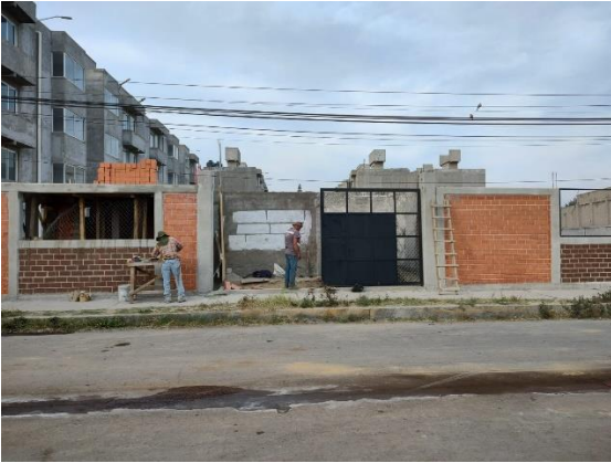
Imagen 1. Limpieza de fachada en Tlaxillacalli octubre de 2022