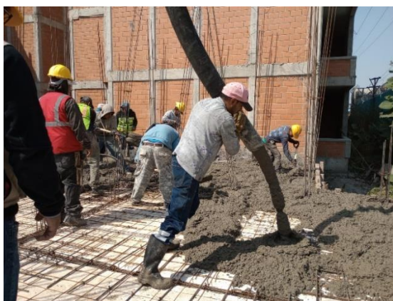
Imagen 6. Colado de losa de entepiso en Manzana #25 enero del 2023