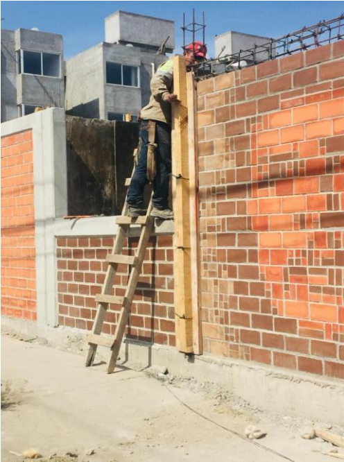
Imagen 5. Colocación de murales en Tlaxillacalli enero de 2023