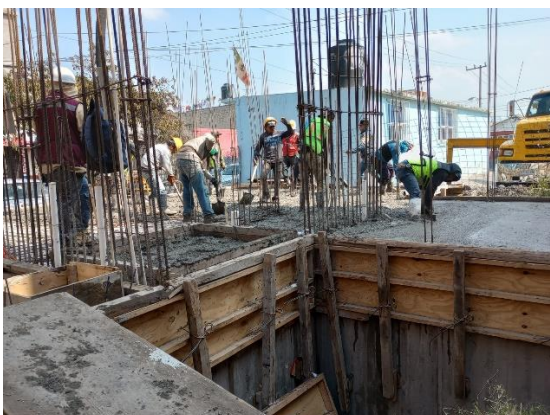
Imagen 3. Colado de cisterna en Manzana #25 noviembre del 2022