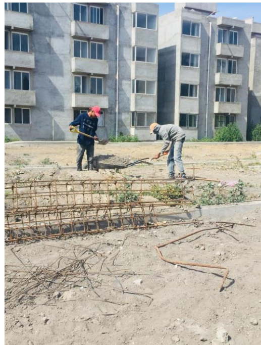
Imagen 4. Habilitado de acero en Tlaxillacalli diciembre de 2022