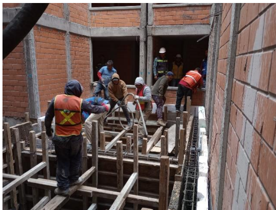
Imagen 4. Habilitado de acero en Manzana #25 noviembre del 2023