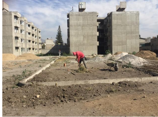
Imagen 2. Colocación de adcreto en Tlaxillacalli noviembre de 2022