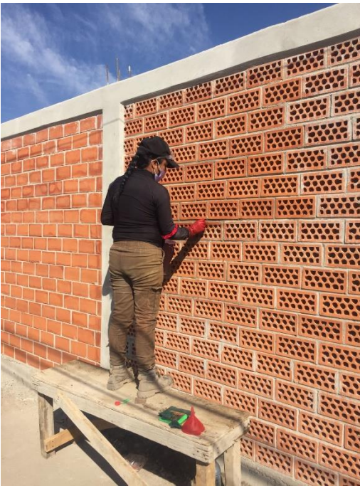
Imagen 3. Colocación de block cerámico en Tlaxillacalli diciembre de 2022