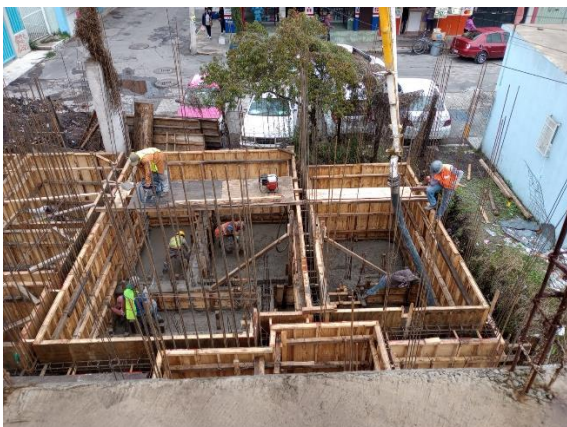
Imagen 1. Colado de cimentación en Manzana #25 octubre de 2022